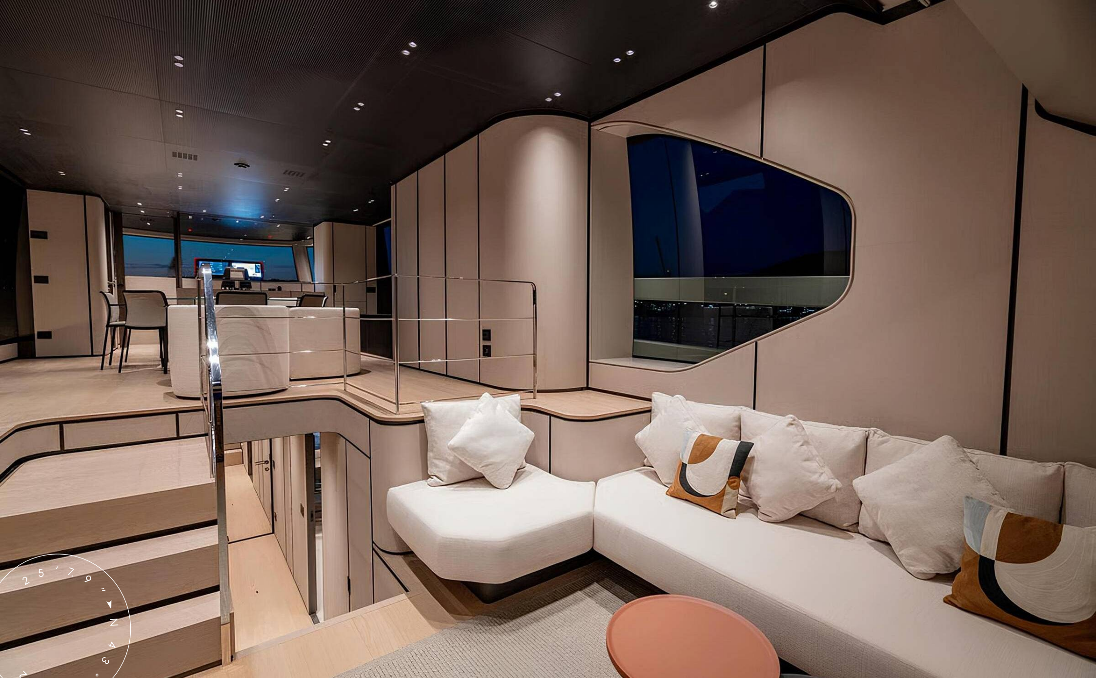
ЗОНА ОТДЫХА В ГЛАВНОМ САЛОНЕ