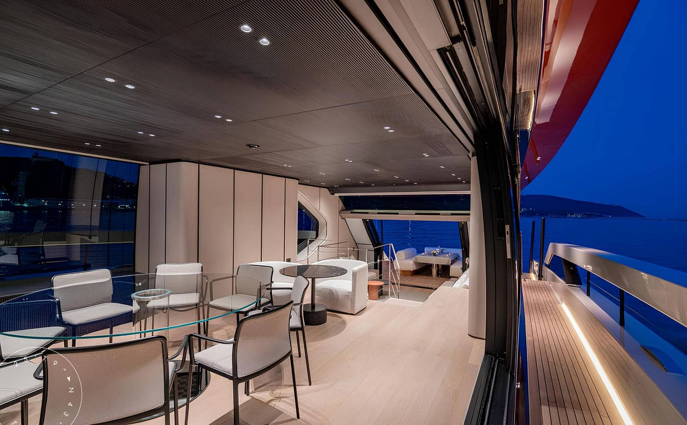
ОБЕДЕННАЯ ЗОНА В ГЛАВНОМ САЛОНЕ