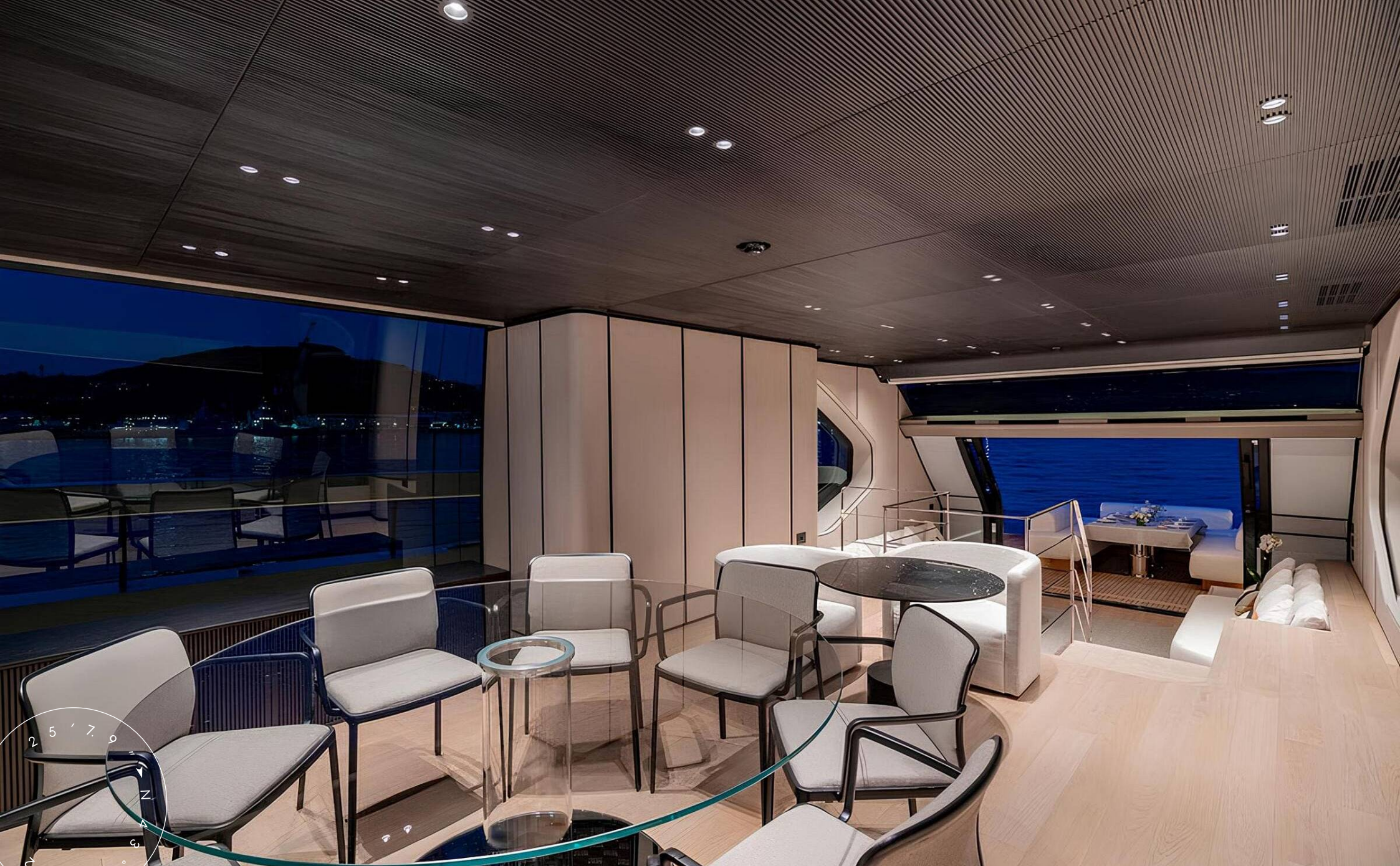
ОБЕДЕННАЯ ЗОНА В ГЛАВНОМ САЛОНЕ