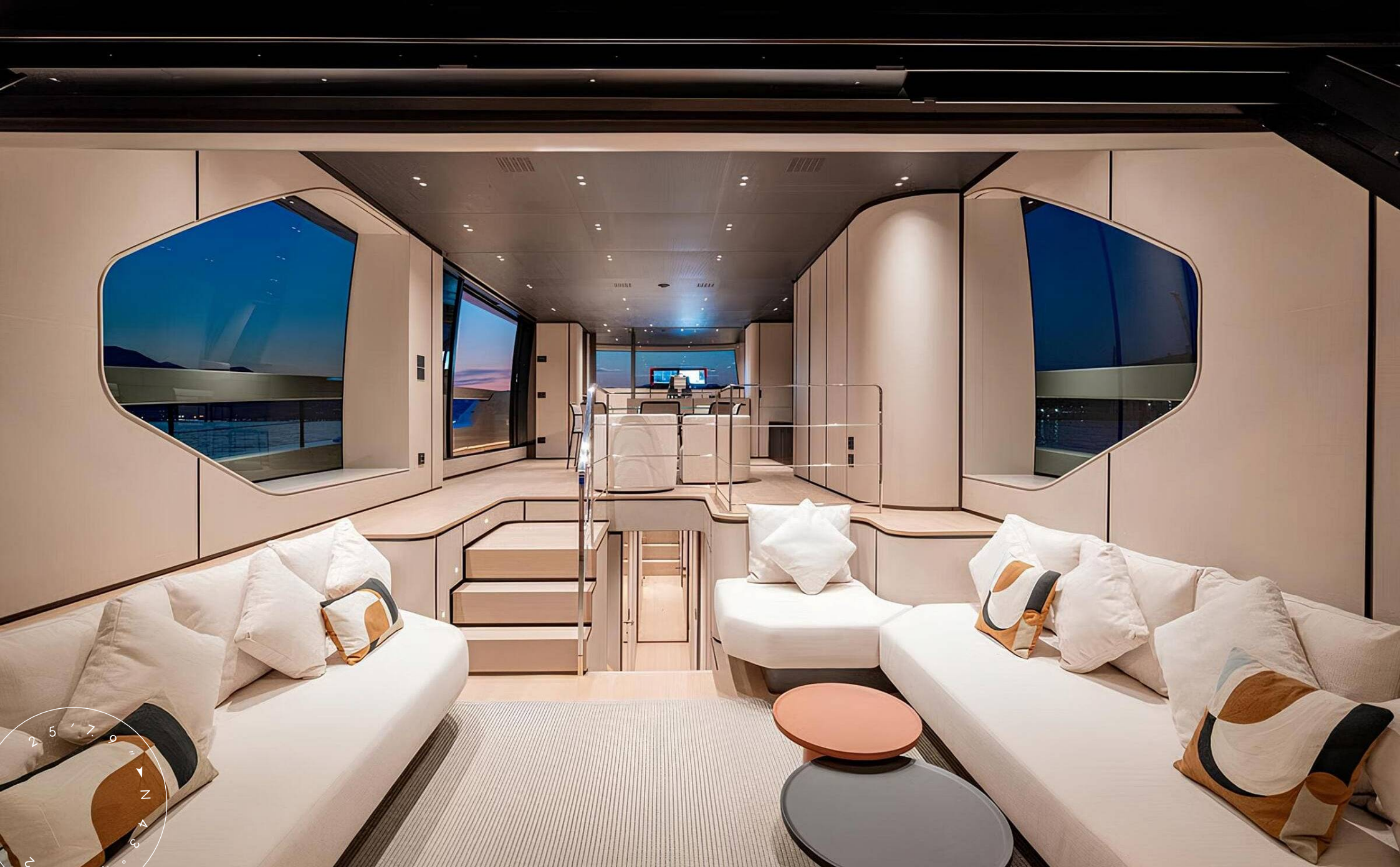
ЗОНА ОТДЫХА В ГЛАВНОМ САЛОНЕ