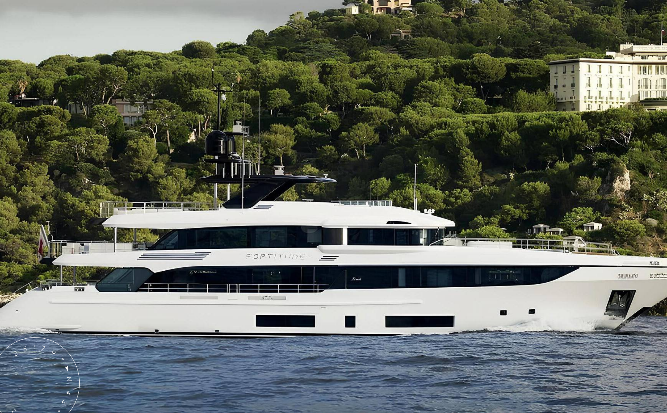
ЭКСТЕРЬЕР BENETTI CLASS 44M 2025 MY FORTITUDE 1