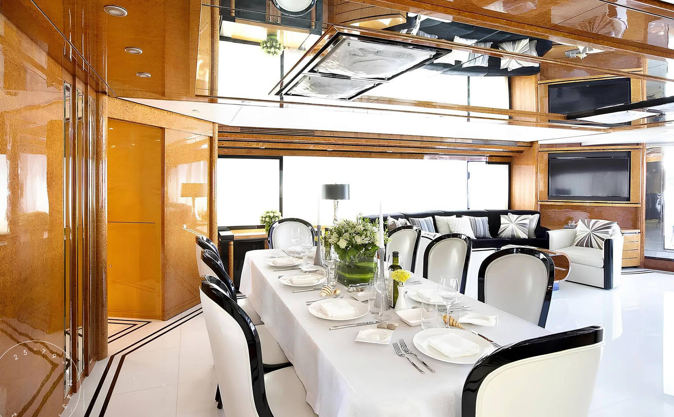
ОБЕДЕННАЯ ЗОНА В ГЛАВНОМ САЛОНЕ