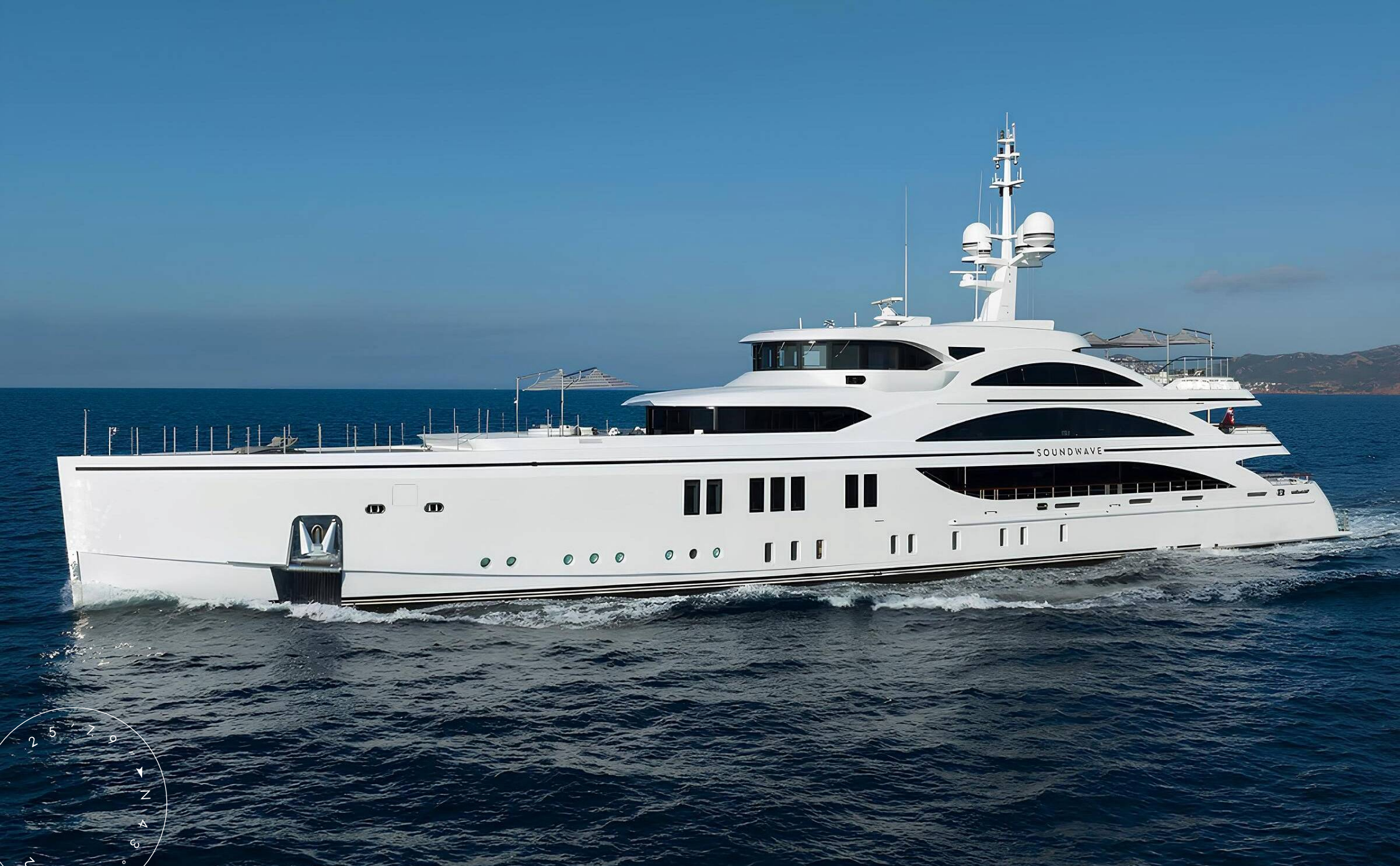
ЭКСТЕРЬЕР BENETTI 63M 2015 MY SOUNDWAVE