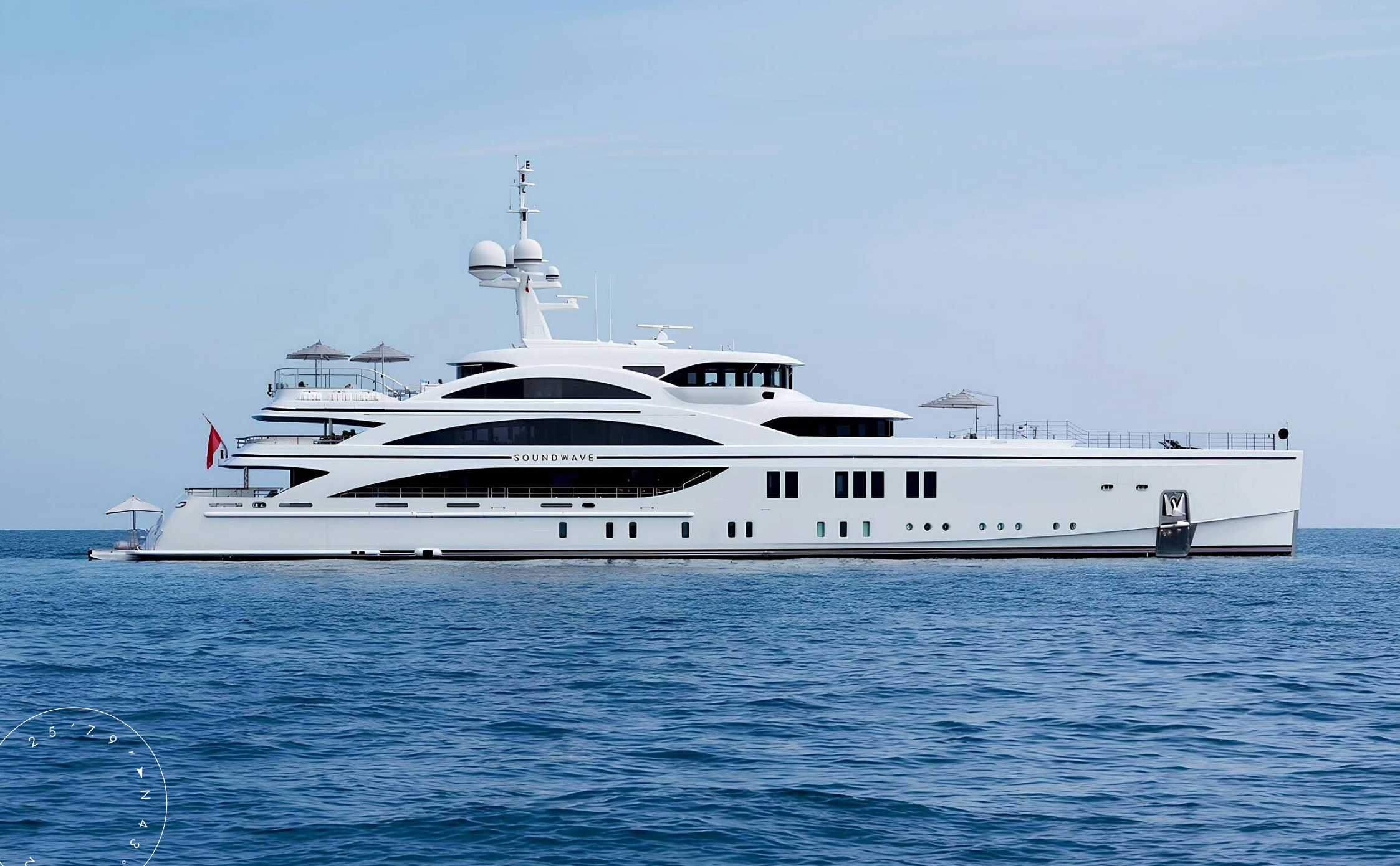
ЭКСТЕРЬЕР BENETTI 63M 2015 MY SOUNDWAVE