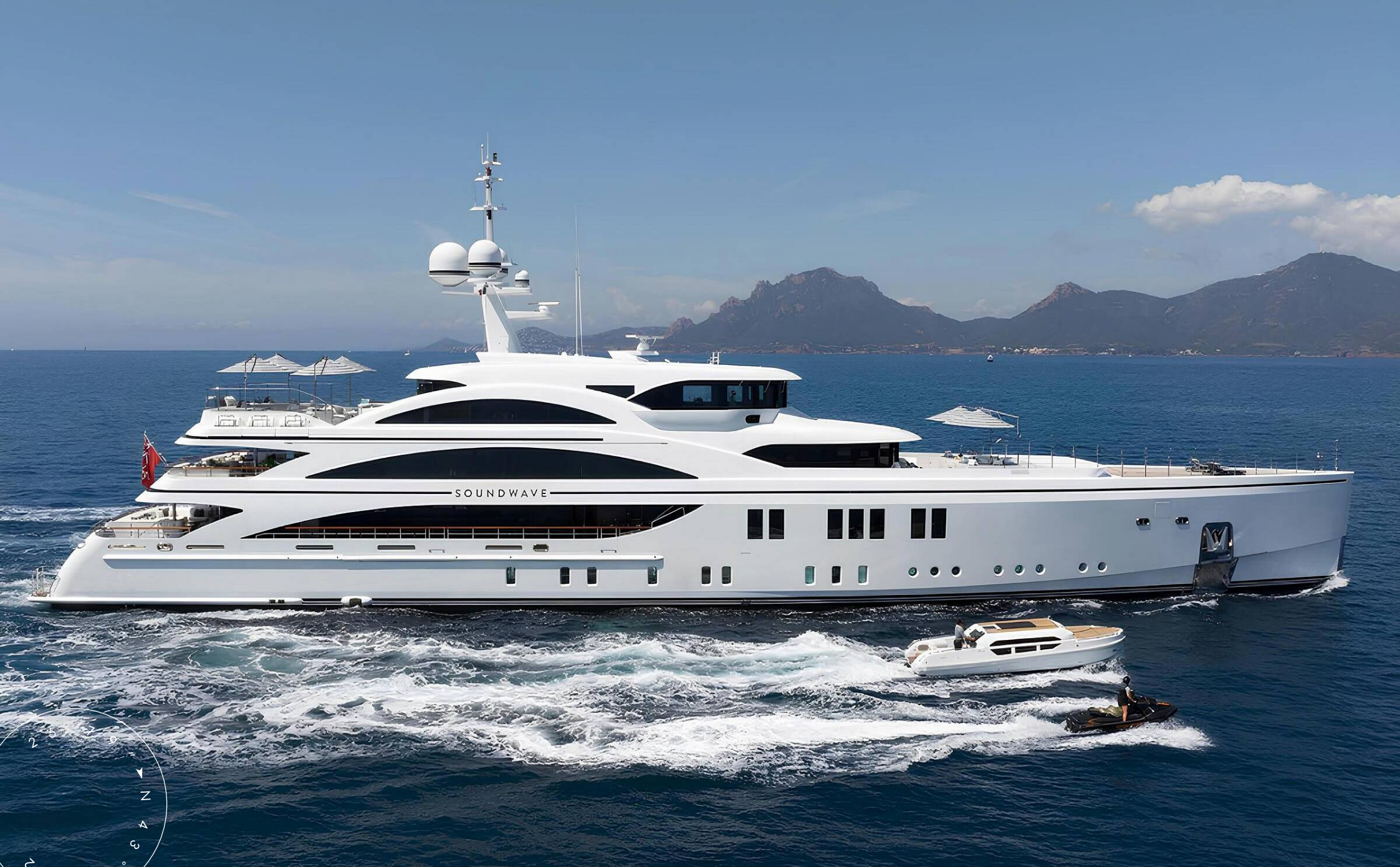
ЭКСТЕРЬЕР BENETTI 63M 2015 MY SOUNDWAVE