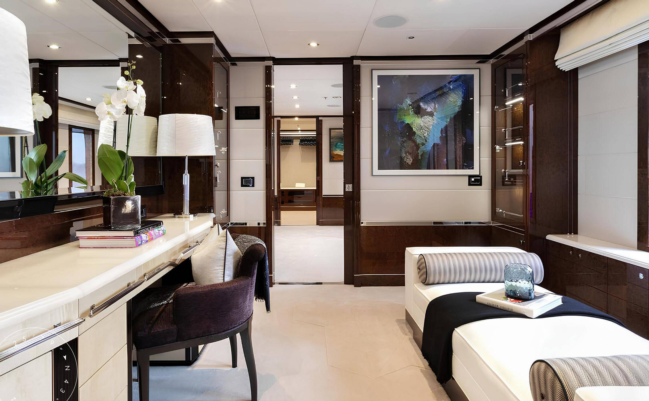
КАБИНЕТ В КАЮТЕ ВЛАДЕЛЬЦА