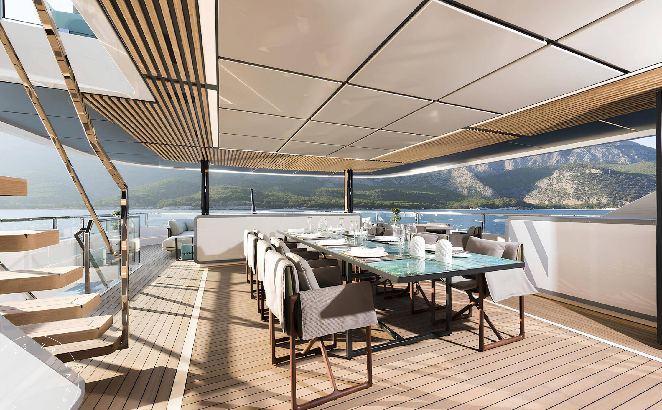
ОБЕДЕННАЯ ЗОНА НА КОРМЕ ВЕРХНЕЙ ПАЛУБЫ