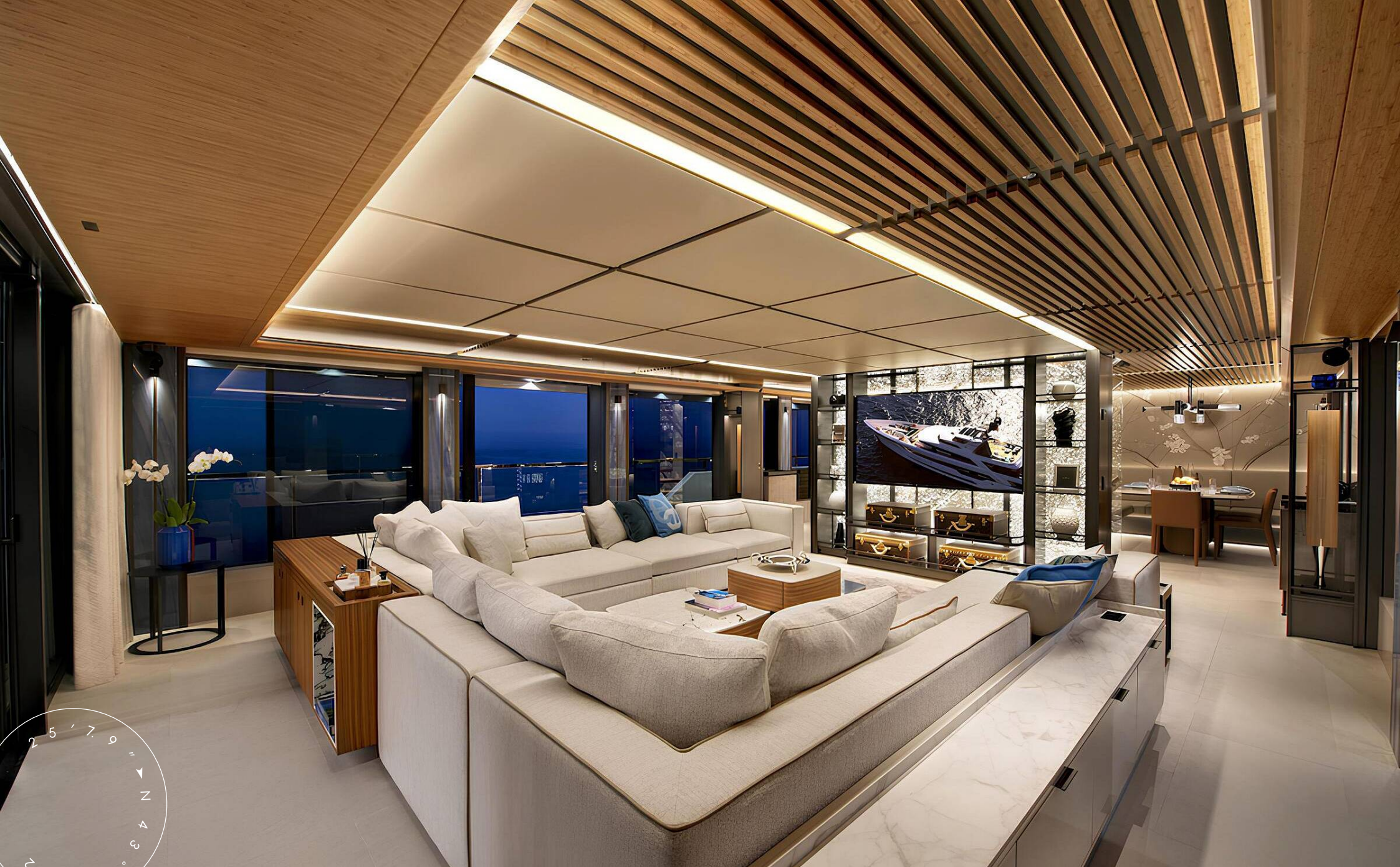
ЗОНА ОТДЫХА В ГЛАВНОМ САЛОНЕ