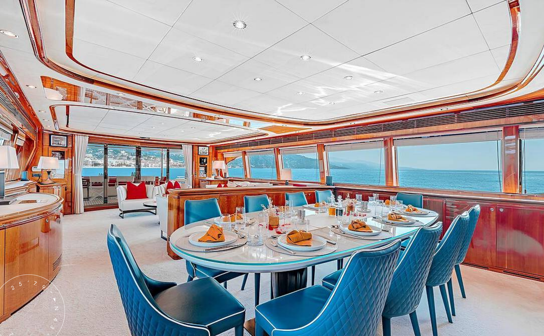
ОБЕДЕННАЯ ЗОНА В ГЛАВНОМ САЛОНЕ