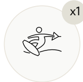
Доска для вейкборда