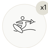
Доска для вейкборда