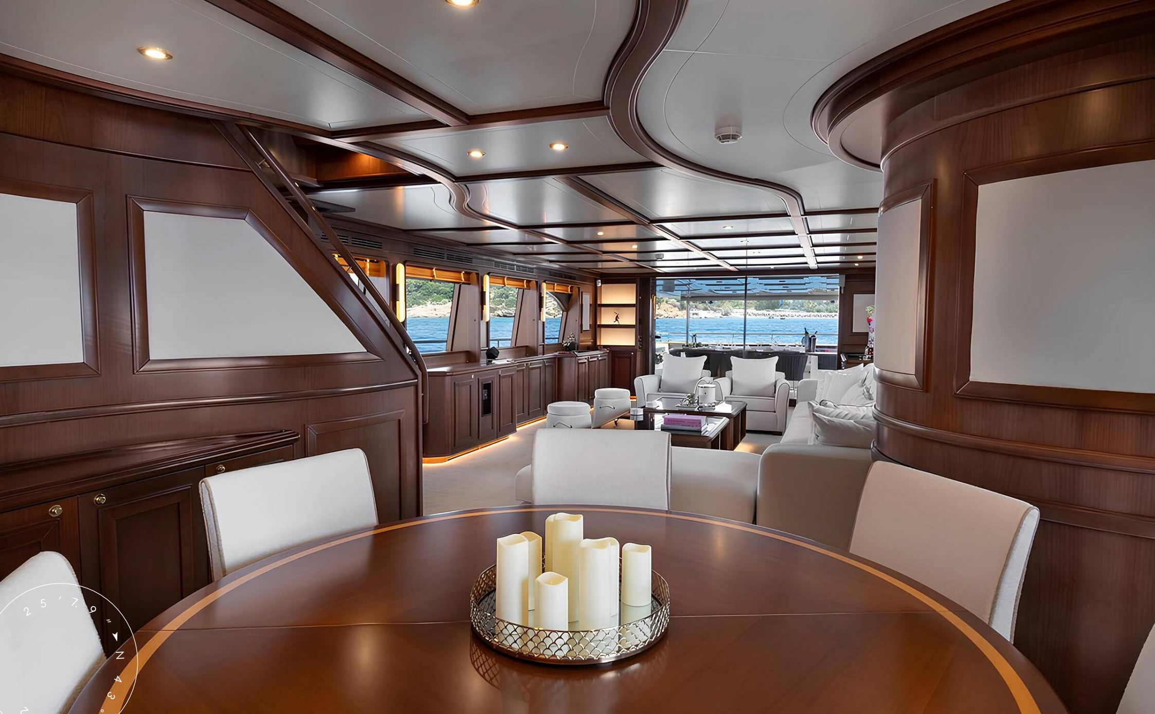
ОБЕДЕННАЯ ЗОНА В ГЛАВНОМ САЛОНЕ