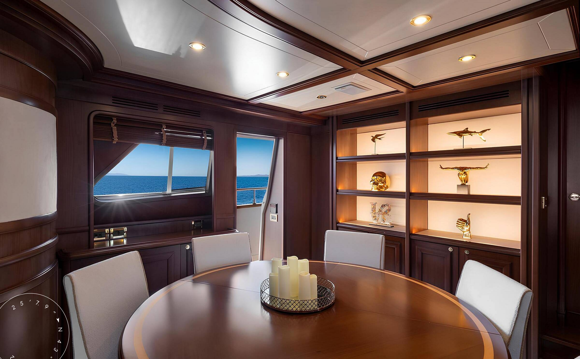
ОБЕДЕННАЯ ЗОНА В ГЛАВНОМ САЛОНЕ