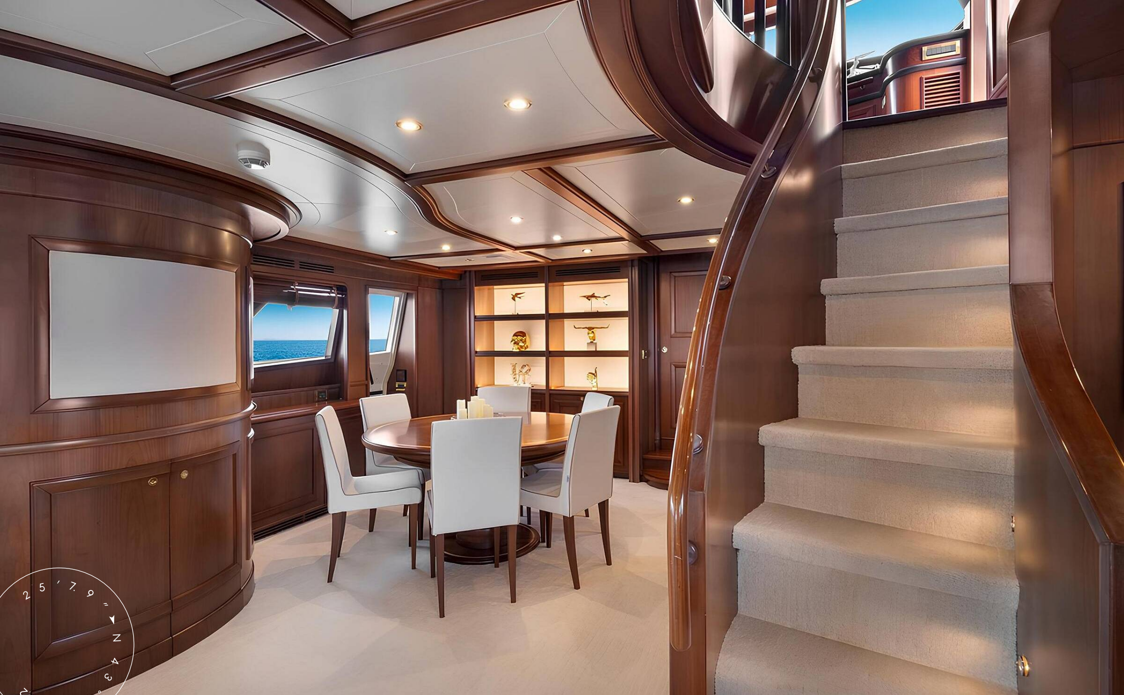
ОБЕДЕННАЯ ЗОНА В ГЛАВНОМ САЛОНЕ