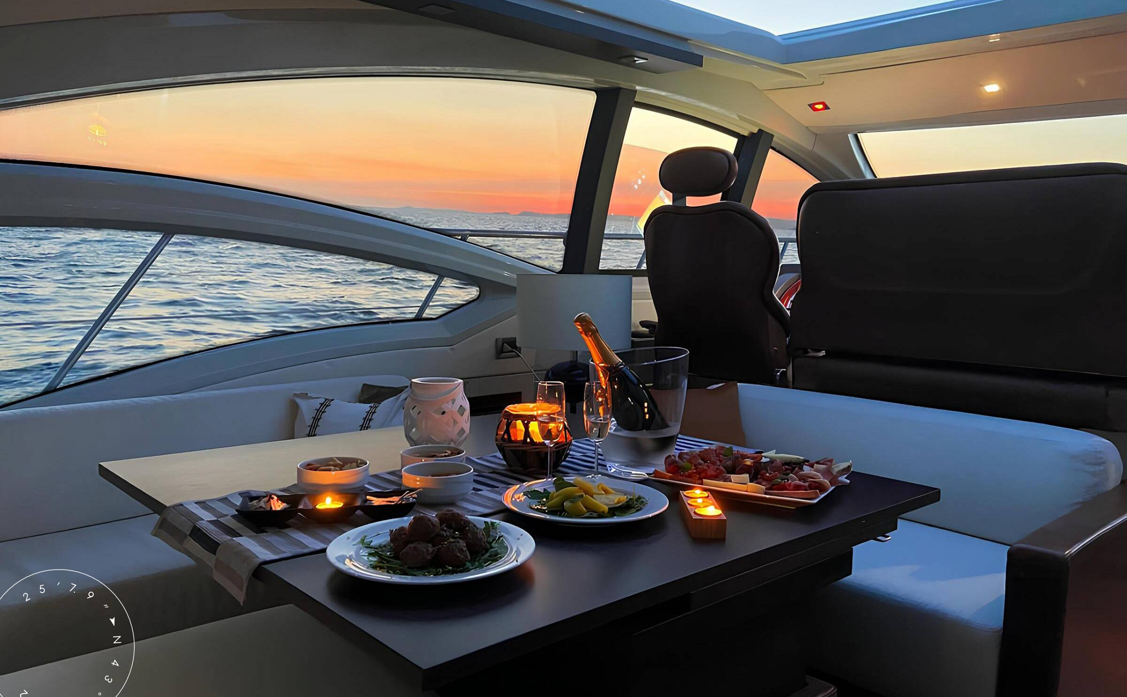
ОБЕДЕННАЯ ЗОНА В ГЛАВНОМ САЛОНЕ