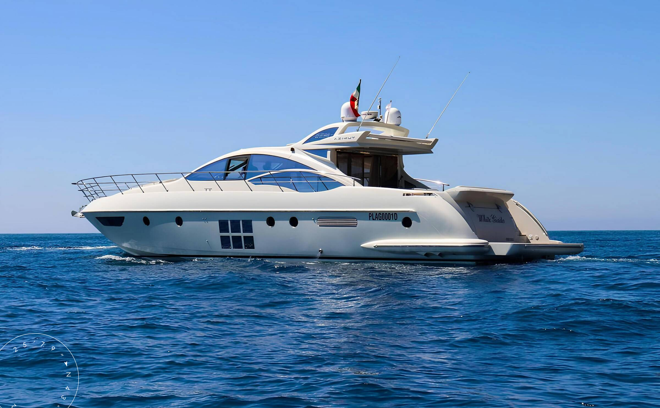
ЭКСТЕРЬЕР AZIMUT 62S 2008 MY MARYGRACE