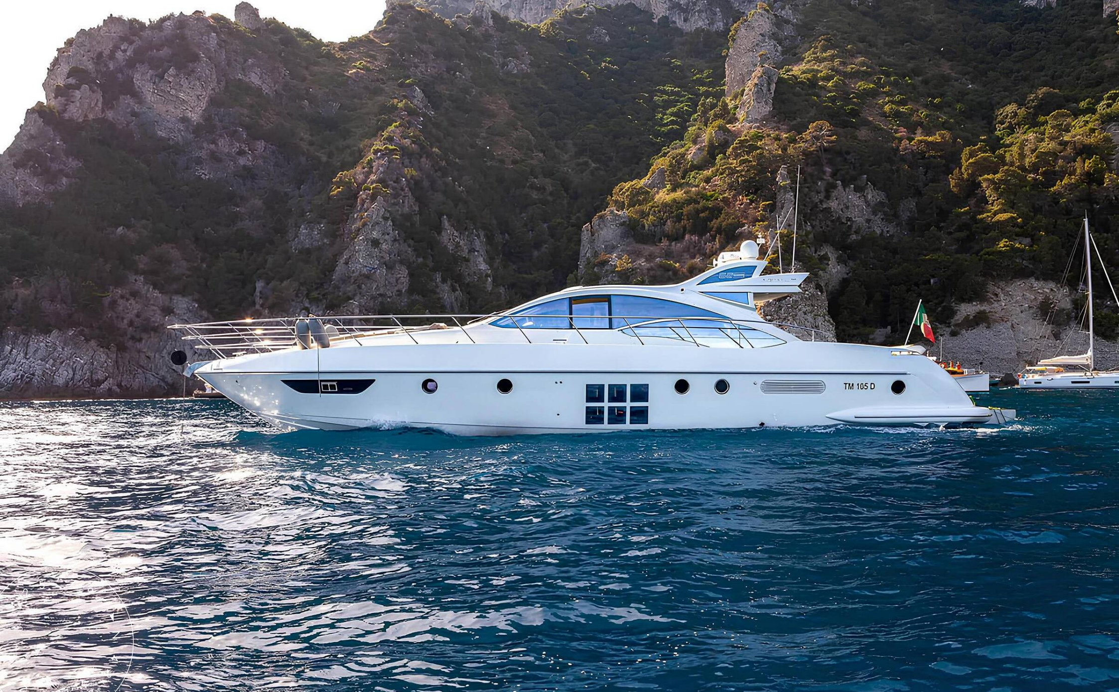
ЭКСТЕРЬЕР AZIMUT 62S 2008 MY MARYGRACE