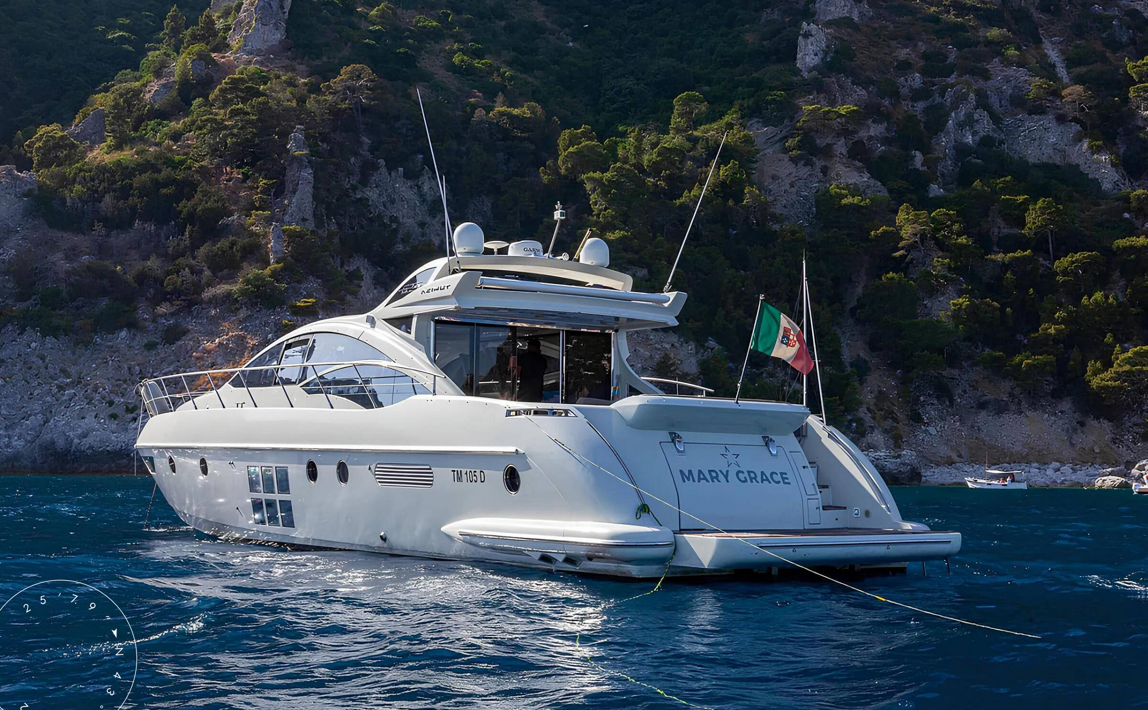
ЭКСТЕРЬЕР AZIMUT 62S 2008 MY MARYGRACE