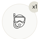
Маски и ласты