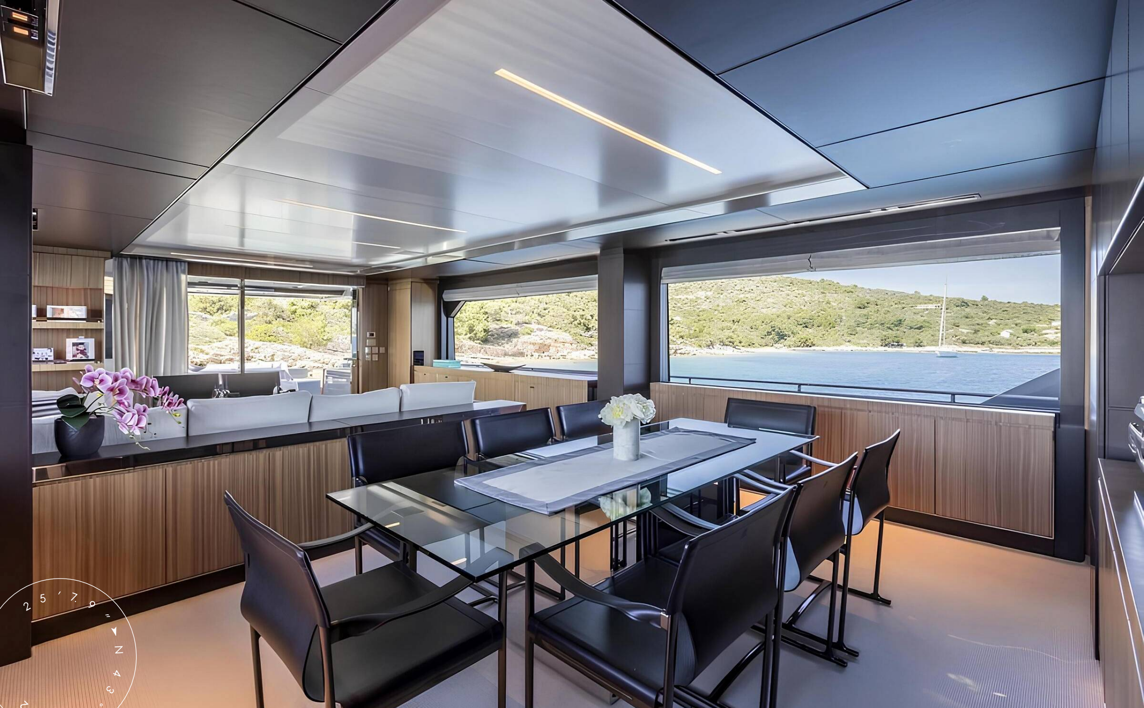
ОБЕДЕННАЯ ЗОНА В ГЛАВНОМ САЛОНЕ