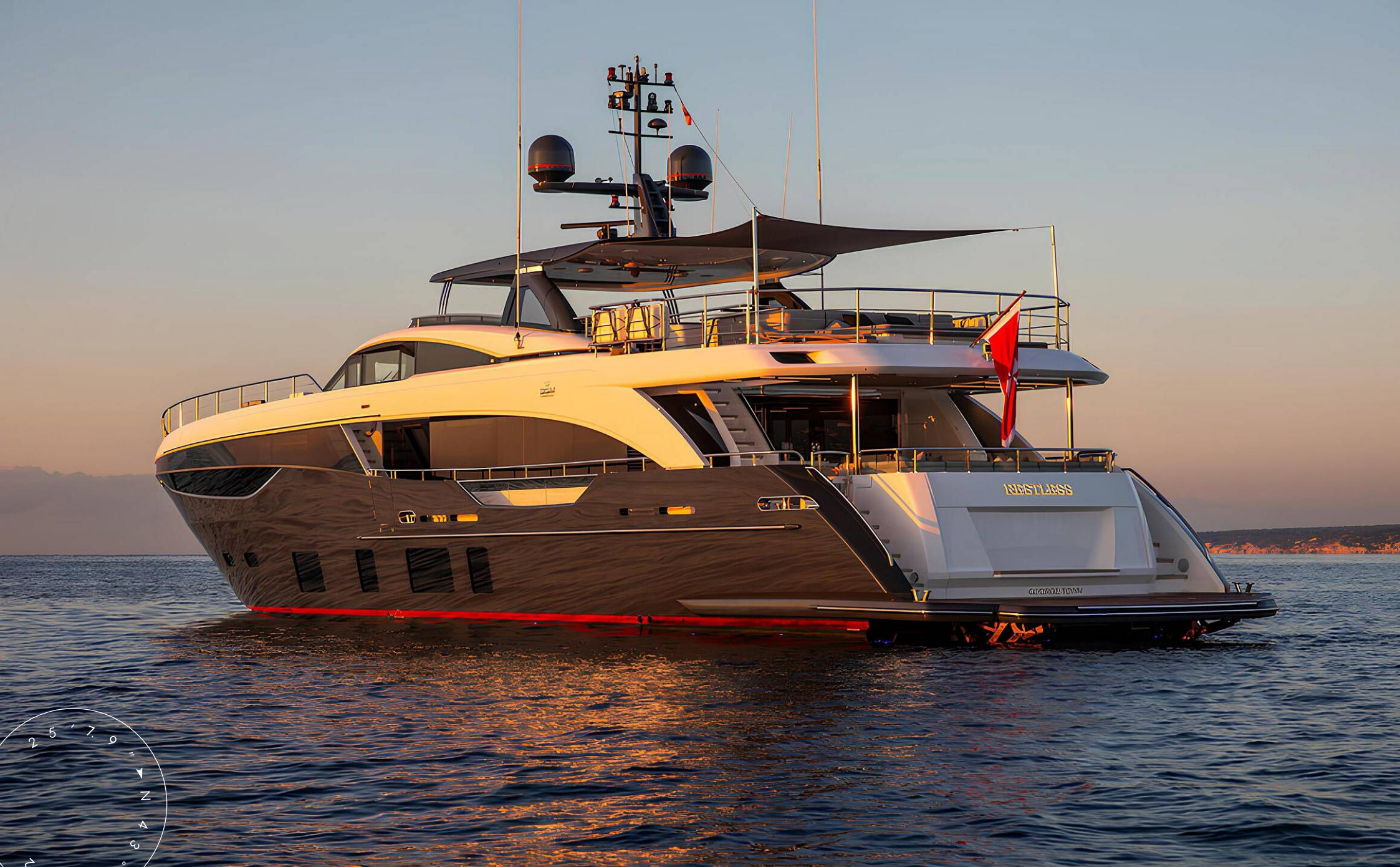
ЭКСТЕРЬЕР PRINCESS 35M 2019 MY RESTLESS