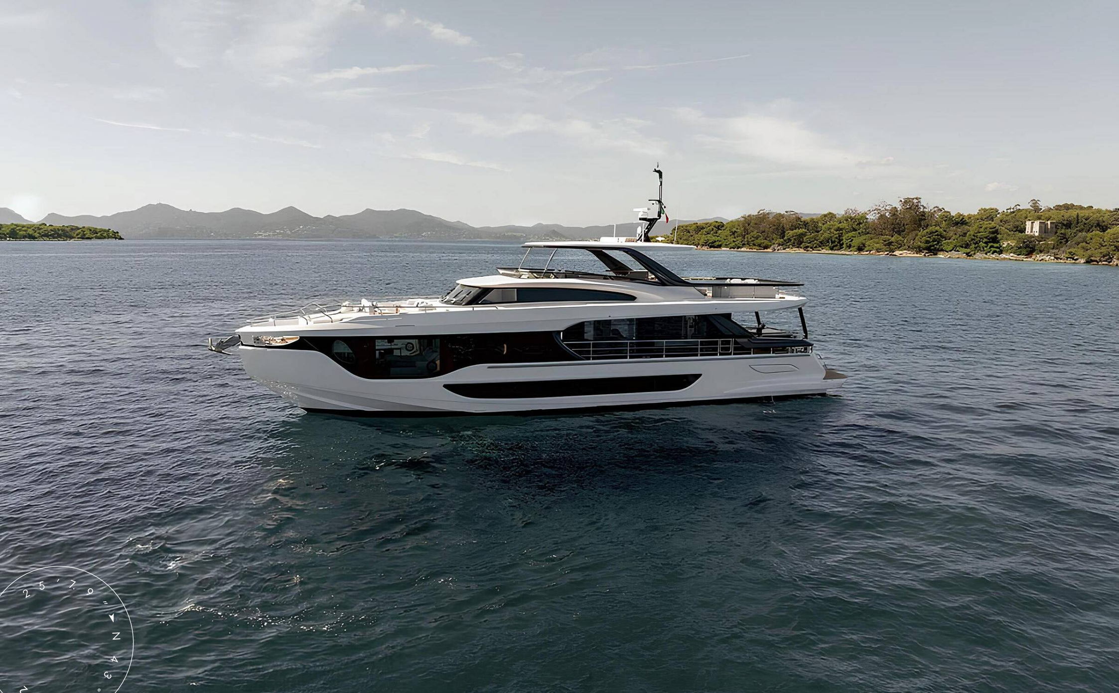
ЭКСТЕРЬЕР AZIMUT GRANDE 26M 2025 MY BK