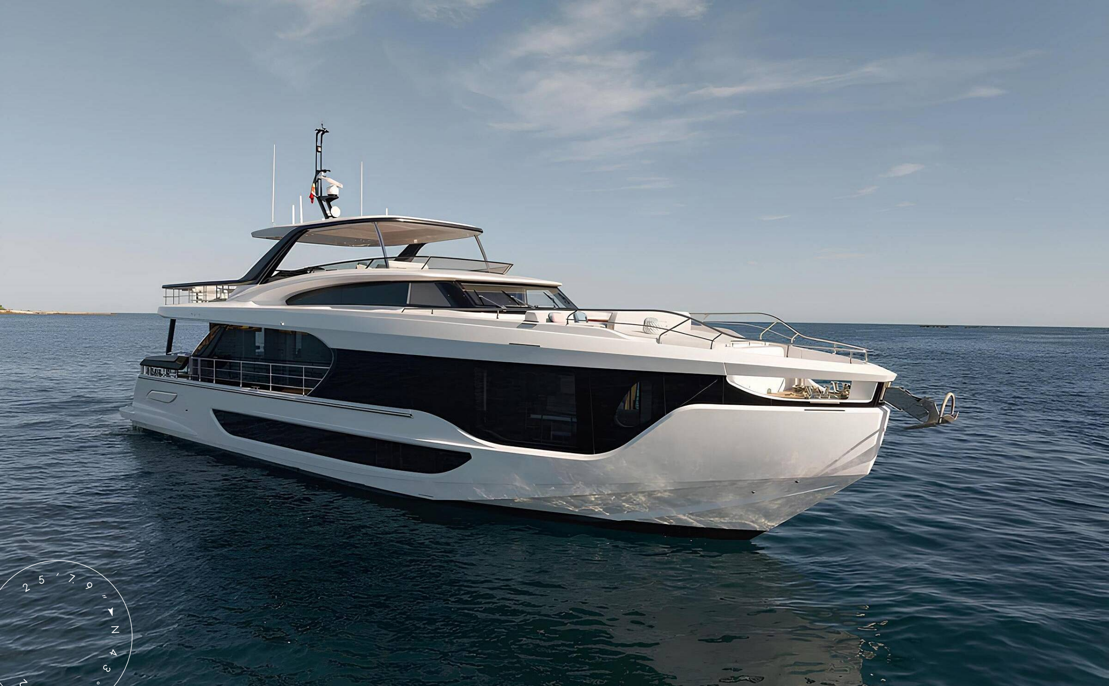
ЭКСТЕРЬЕР AZIMUT GRANDE 26M 2025 MY BK