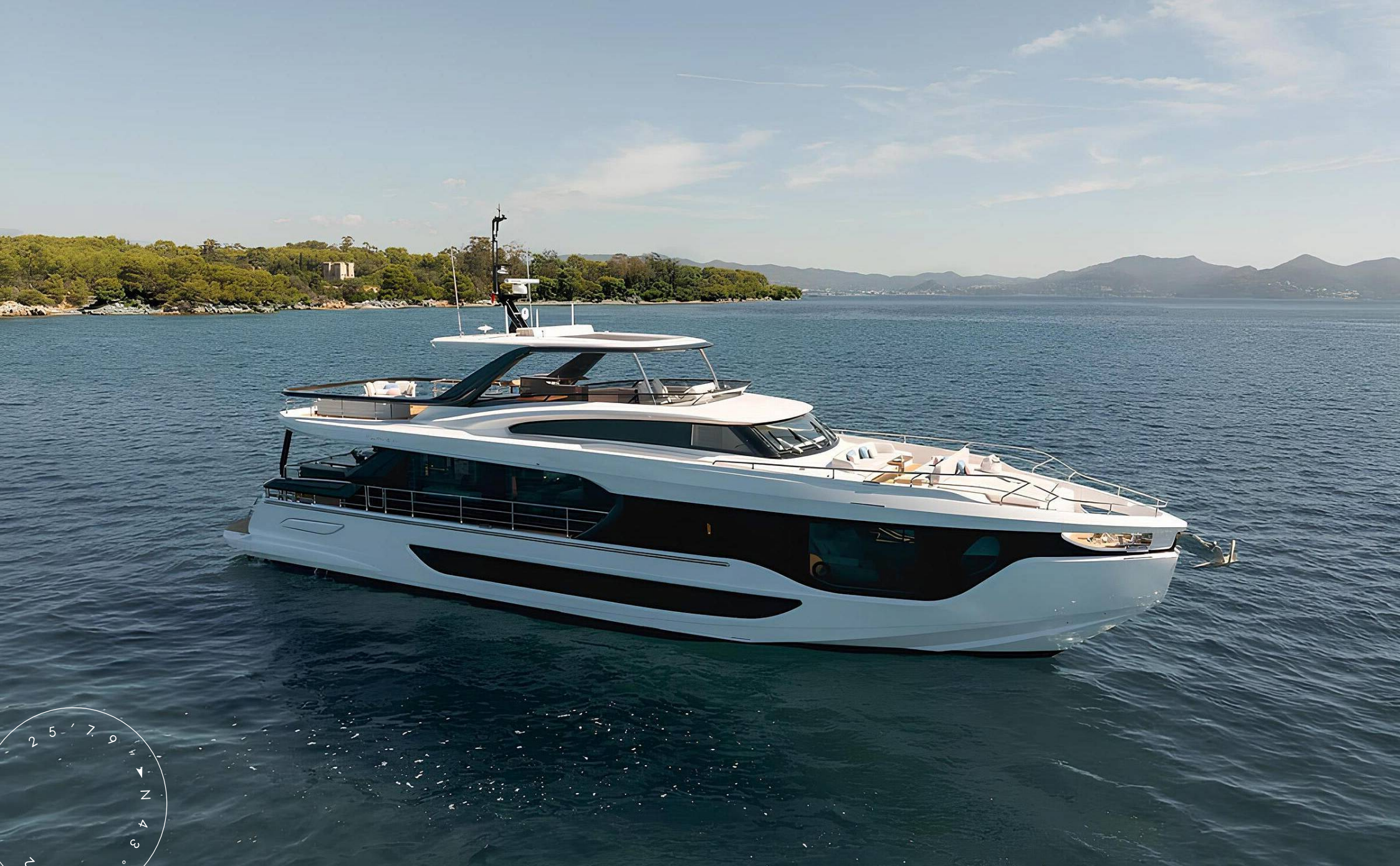
ЭКСТЕРЬЕР AZIMUT GRANDE 26M 2025 MY BK