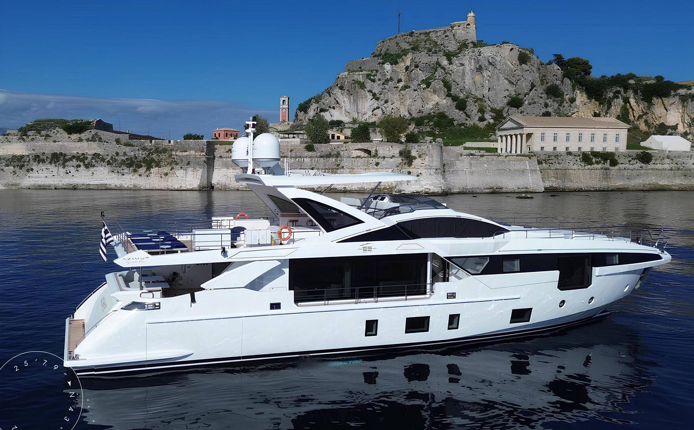
ЭКСТЕРЬЕР AZIMUT GRANDE 32M 2025 MY VOLANTE