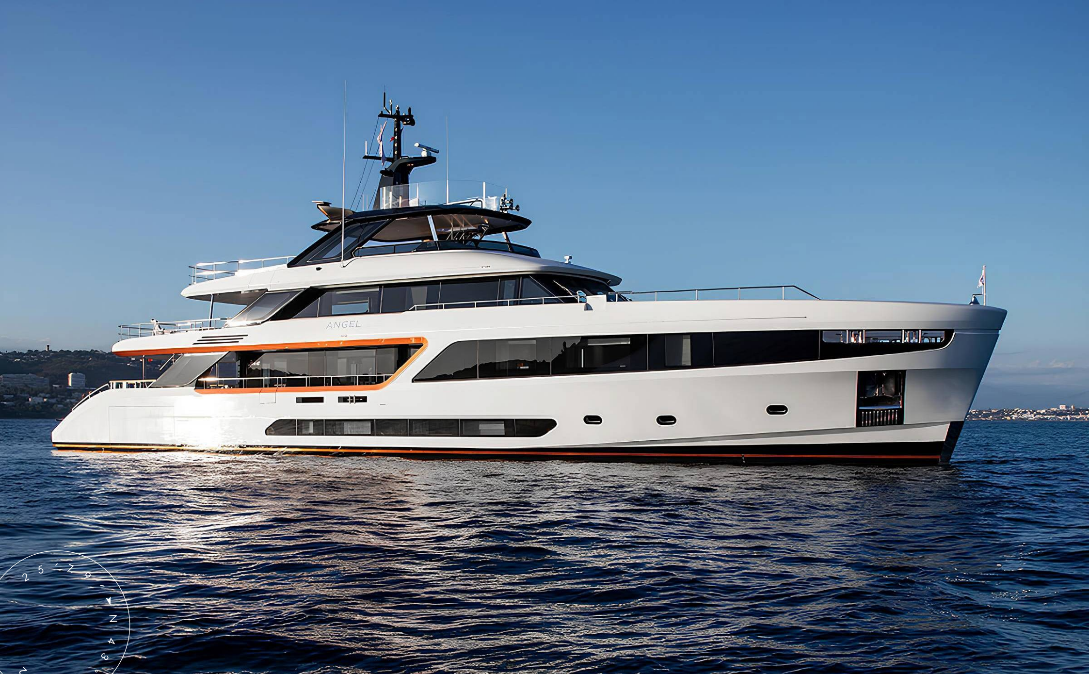
ЭКСТЕРЬЕР BENETTI MOTORANFILO 37M 2025 MY ANGEL