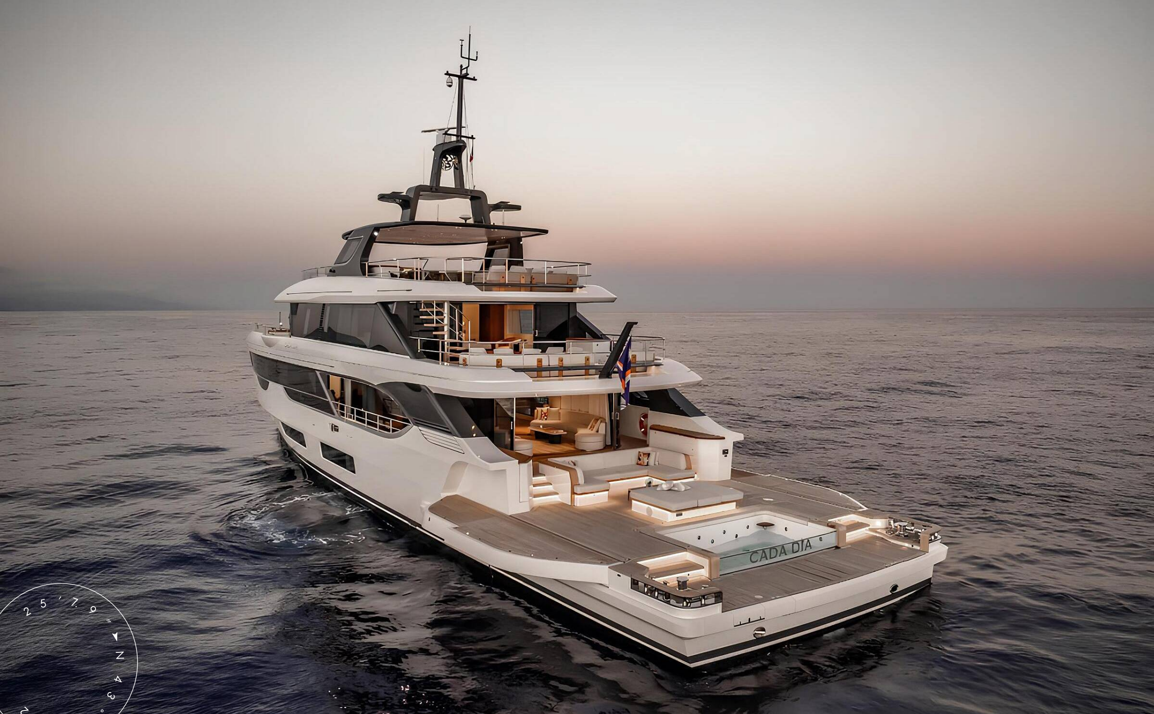
ЭКСТЕРЬЕР BENETTI OASIS 40M 2025 MY CADA DIA