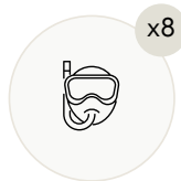
Маски и ласты