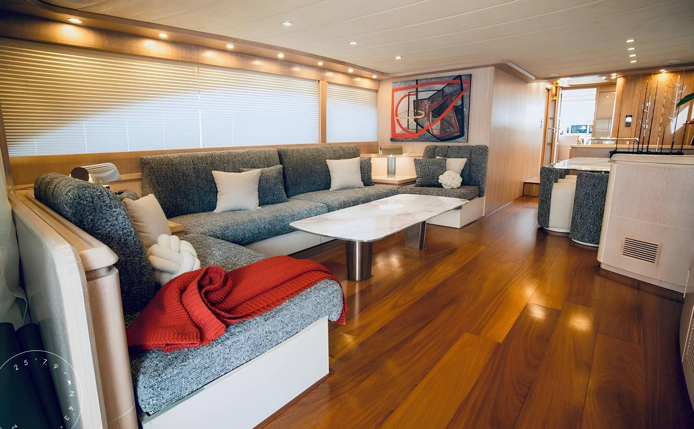
ЗОНА ОТДЫХА В ГЛАВНОМ САЛОНЕ