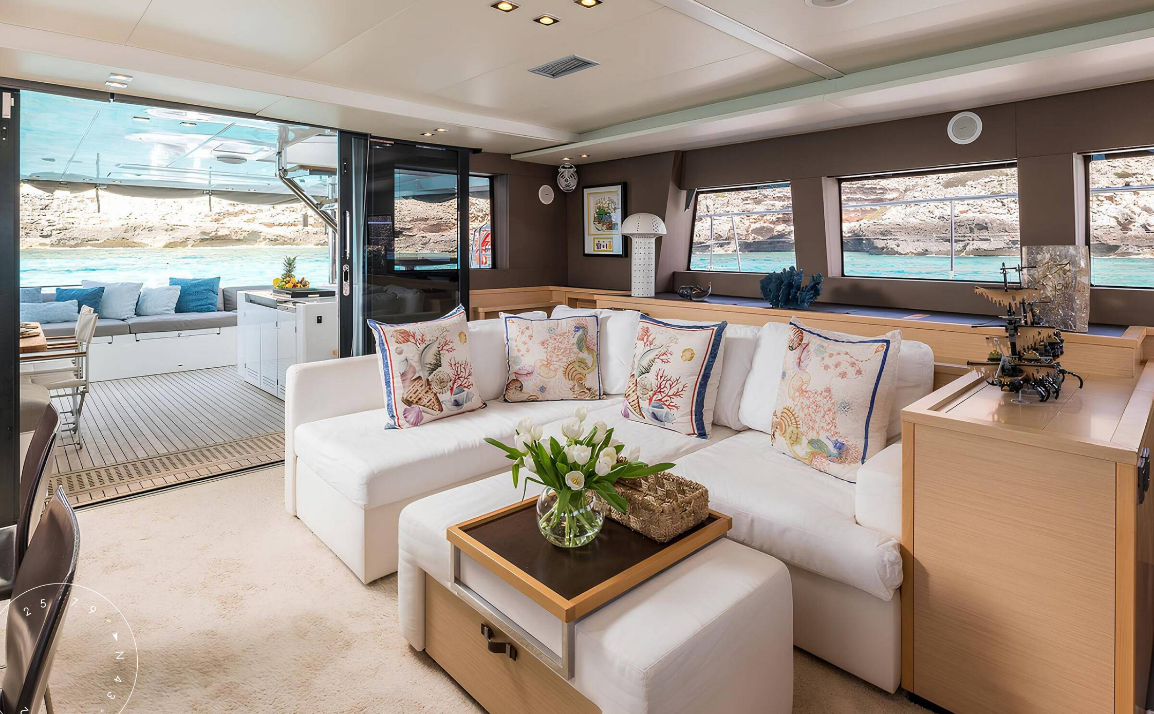
ЗОНА ОТДЫХА В ГЛАВНОМ САЛОНЕ