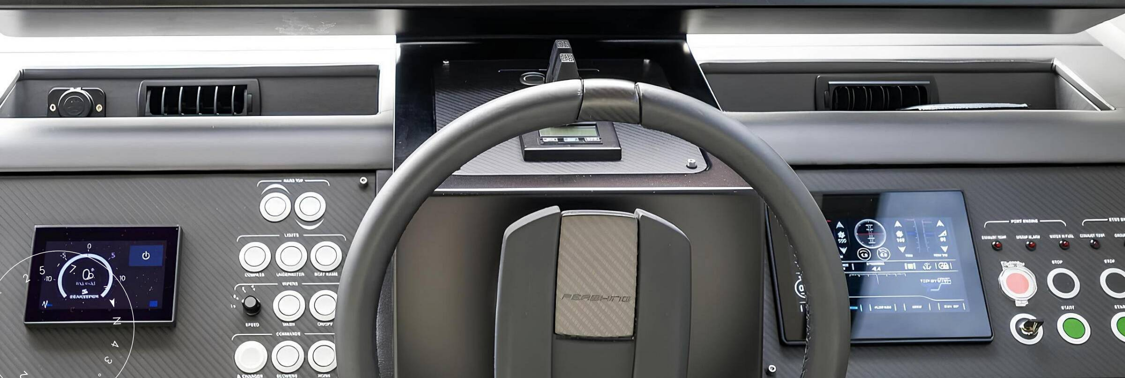
ГЛАВНЫЙ ПОСТ УПРАВЛЕНИЯ