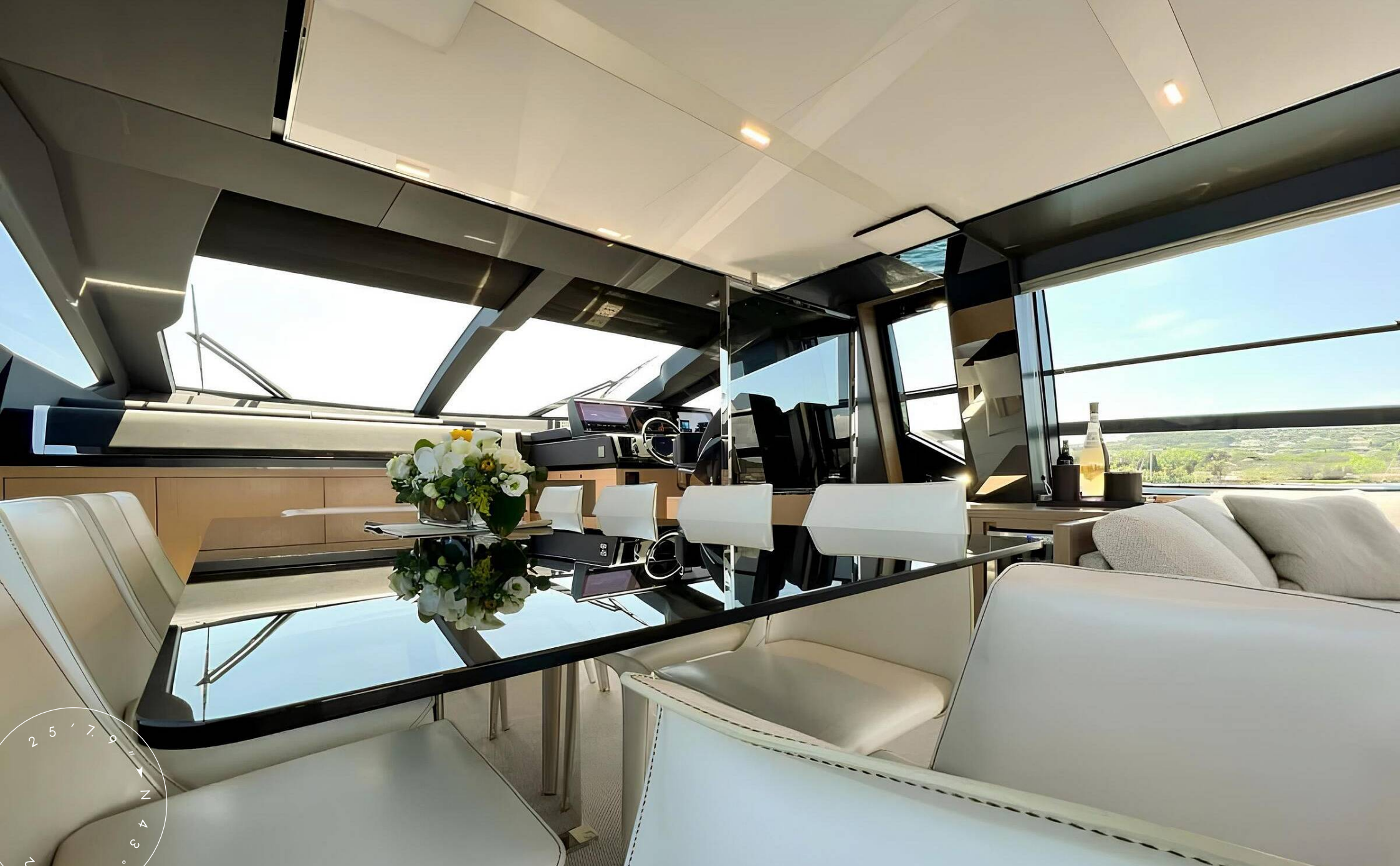
ОБЕДЕННАЯ ЗОНА В ГЛАВНОМ САЛОНЕ