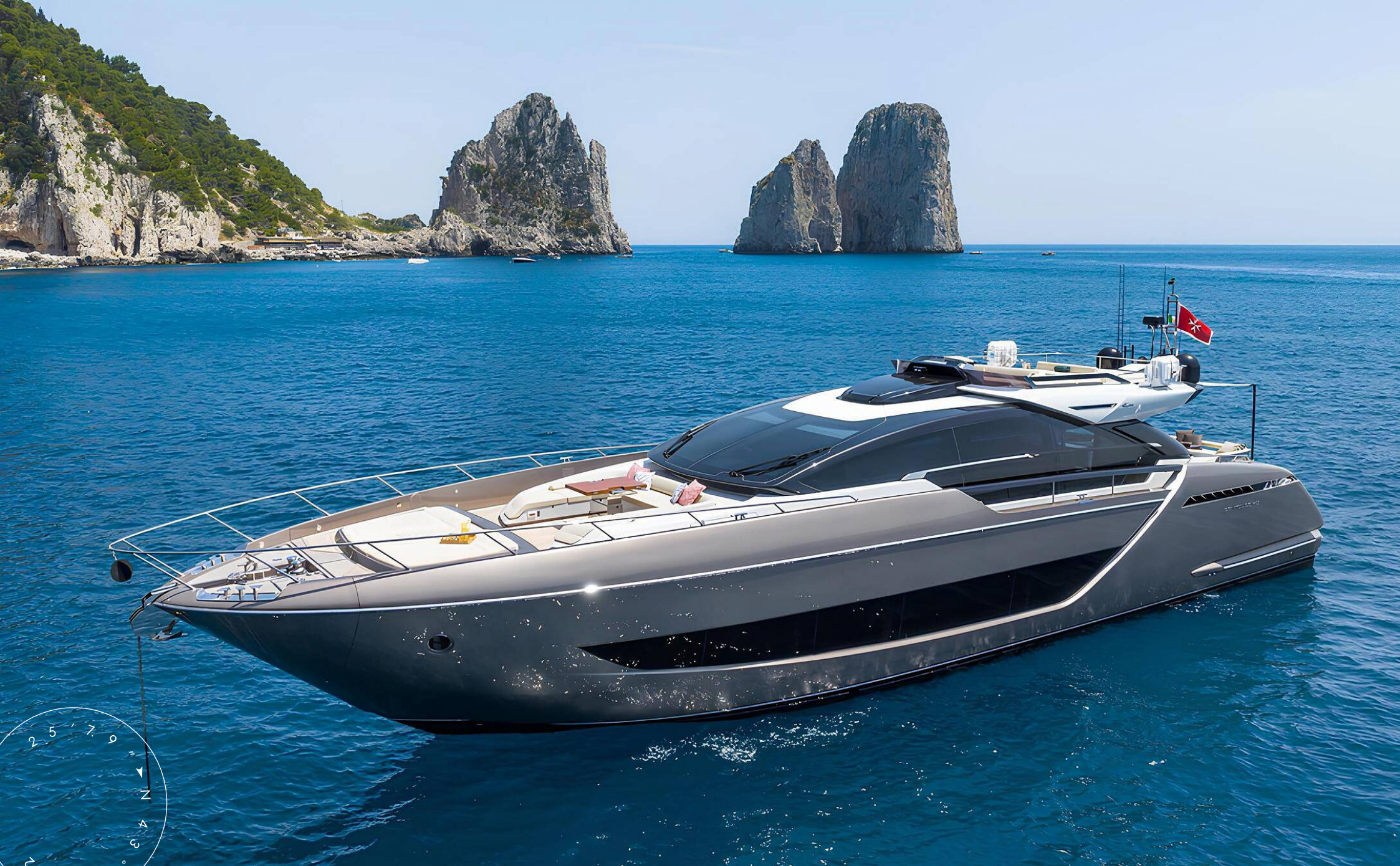
ЭКСТЕРЬЕР RIVA 88' FOLGORE 2021 MY KAR