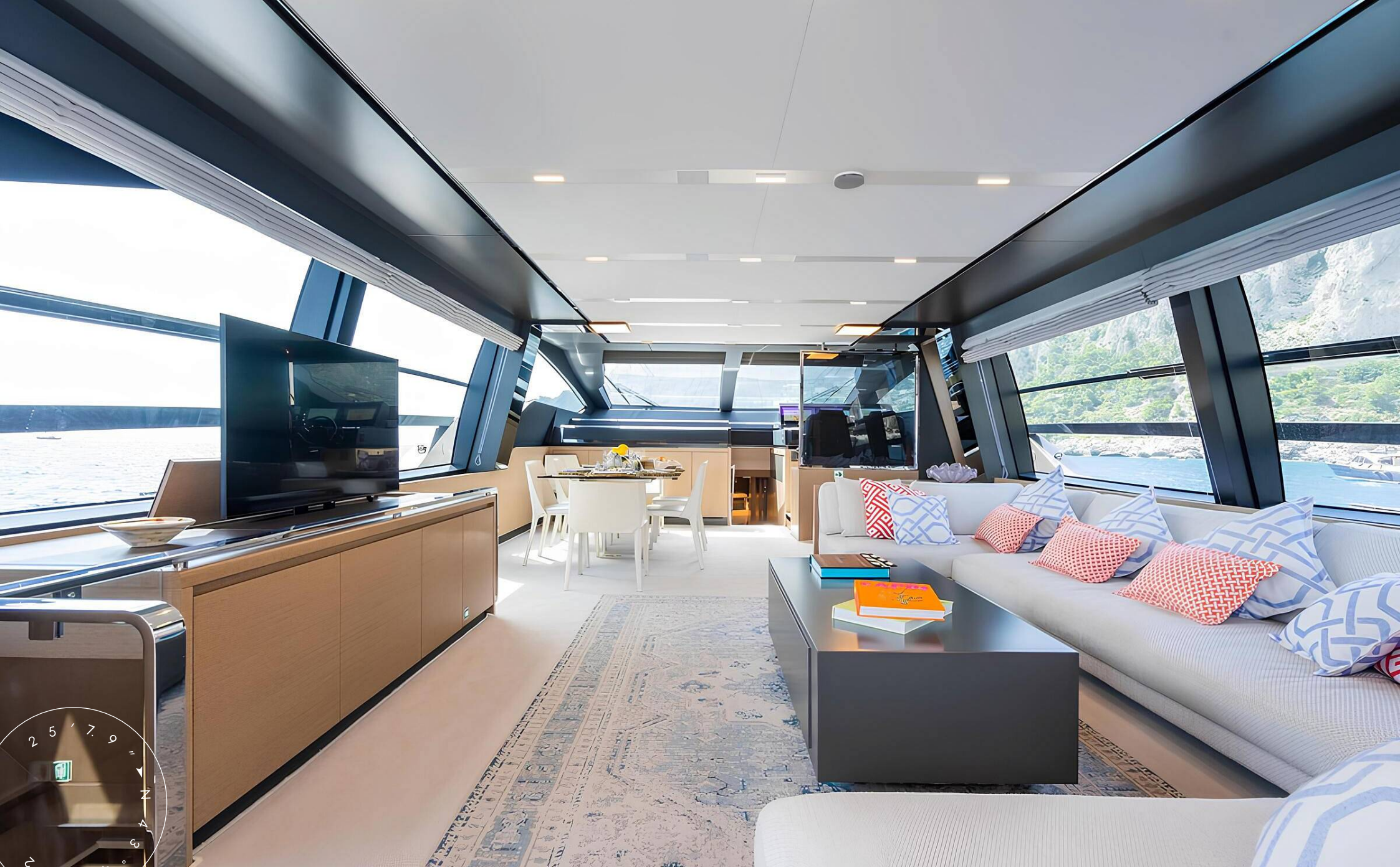
ЗОНА ОТДЫХА В ГЛАВНОМ САЛОНЕ