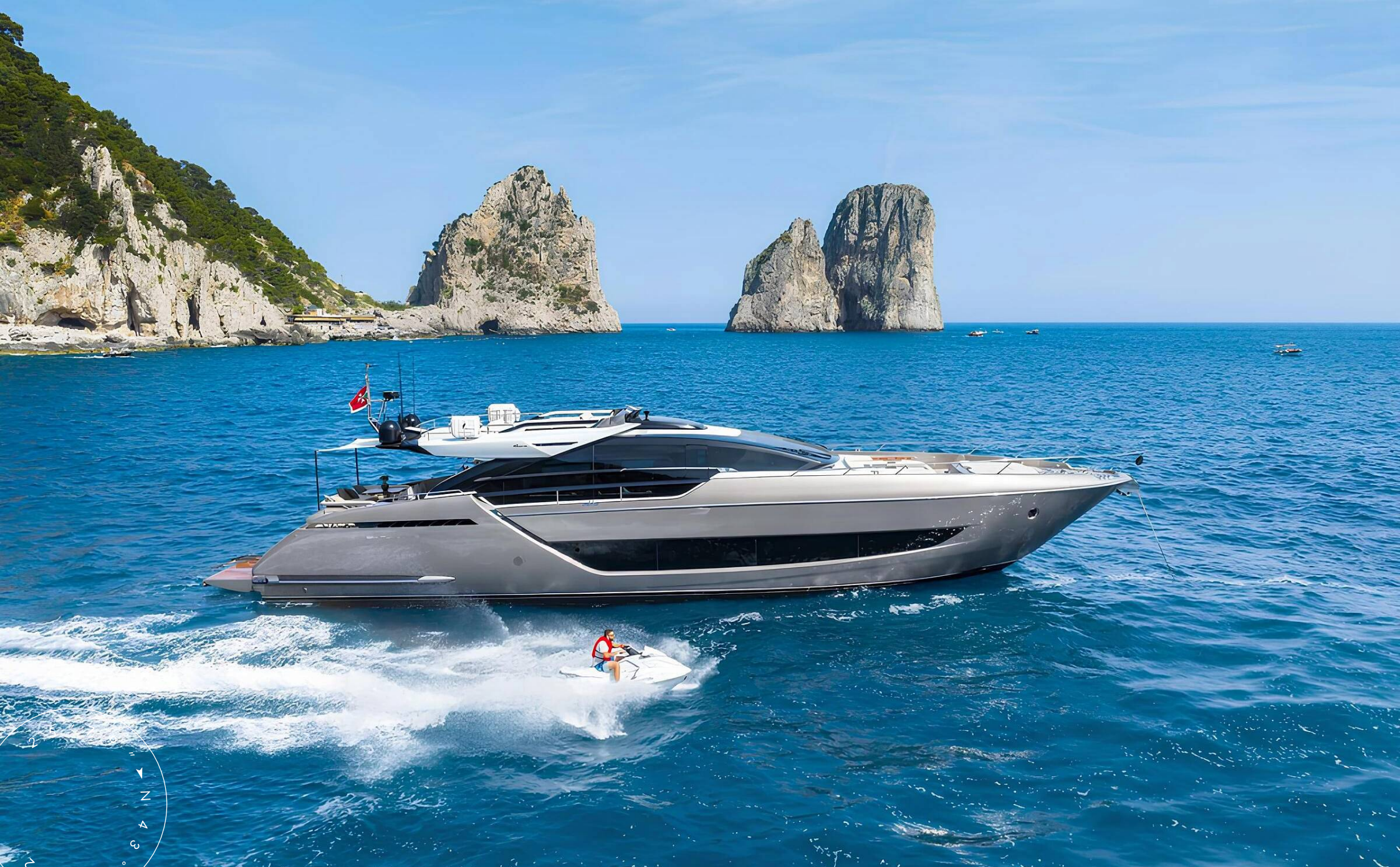
ЭКСТЕРЬЕР RIVA 88' FOLGORE 2021 MY KAR