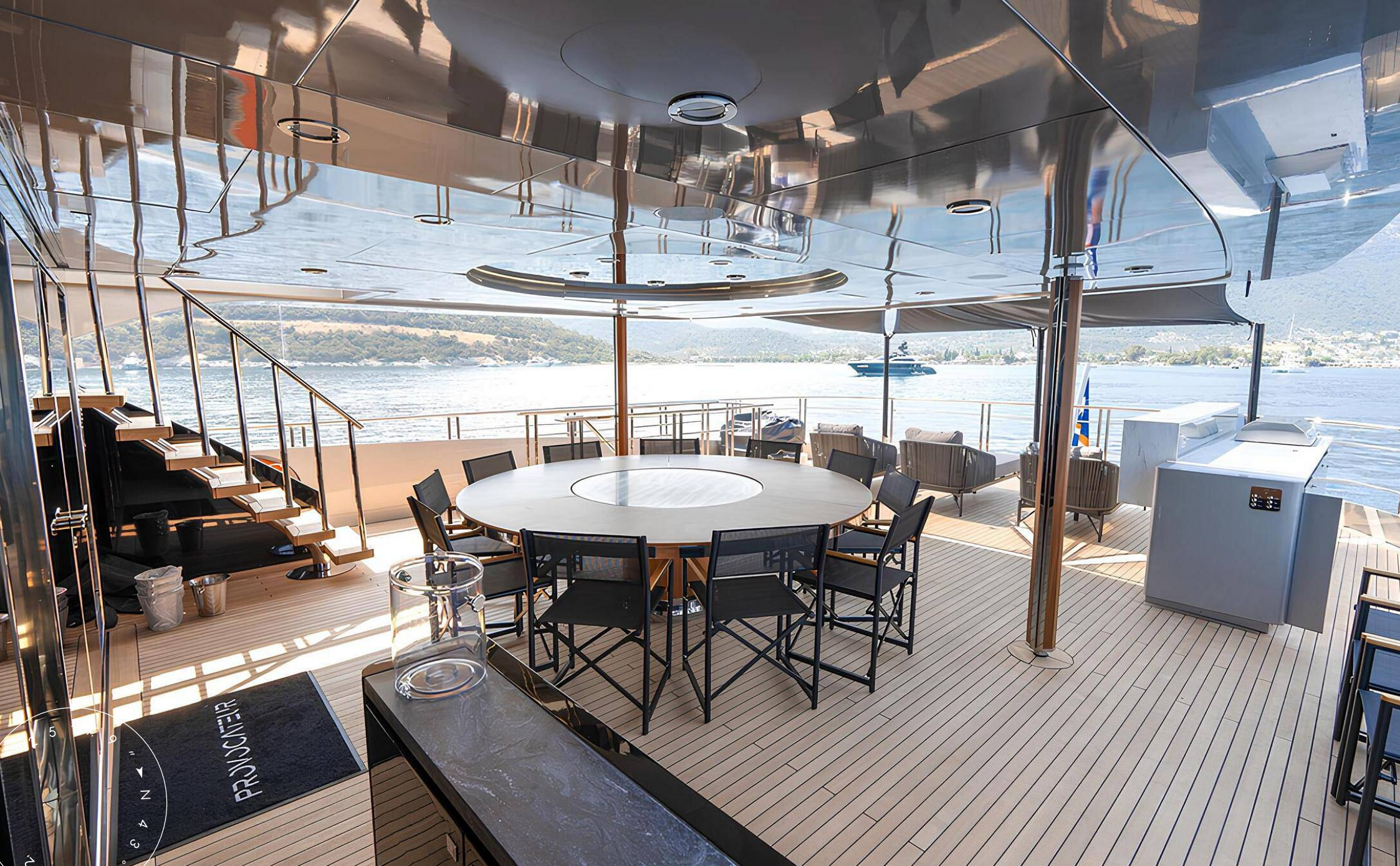
ОБЕДЕННАЯ ЗОНА НА КОРМЕ ВЕРХНЕЙ ПАЛУБЫ