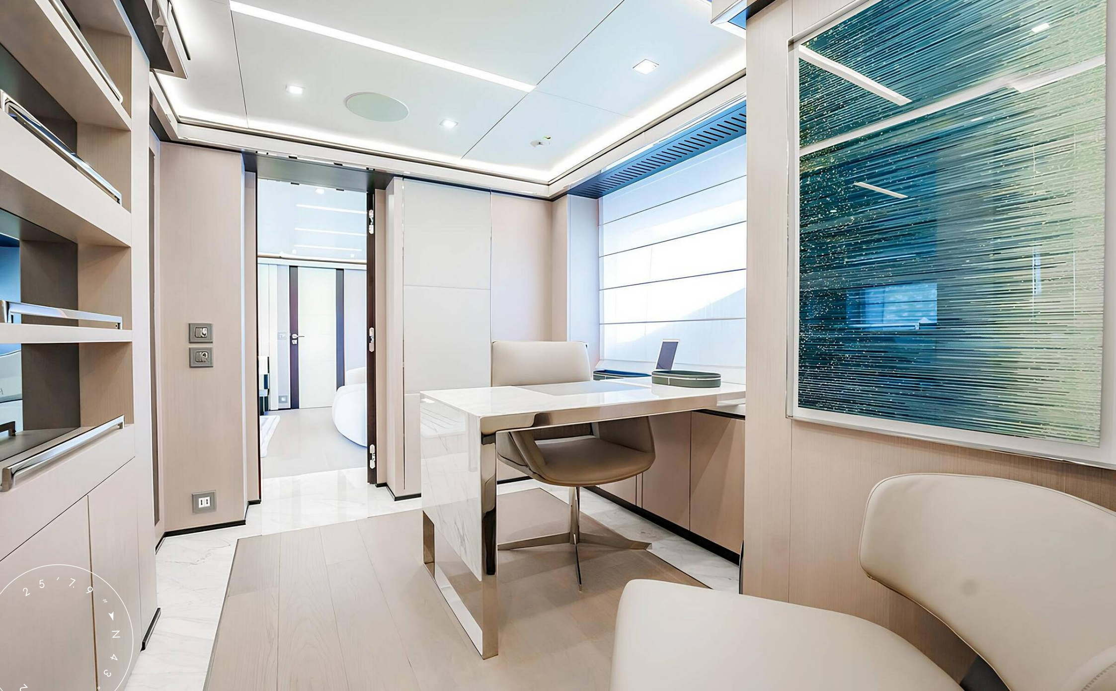
КАБИНЕТ В КАЮТЕ ВЛАДЕЛЬЦА