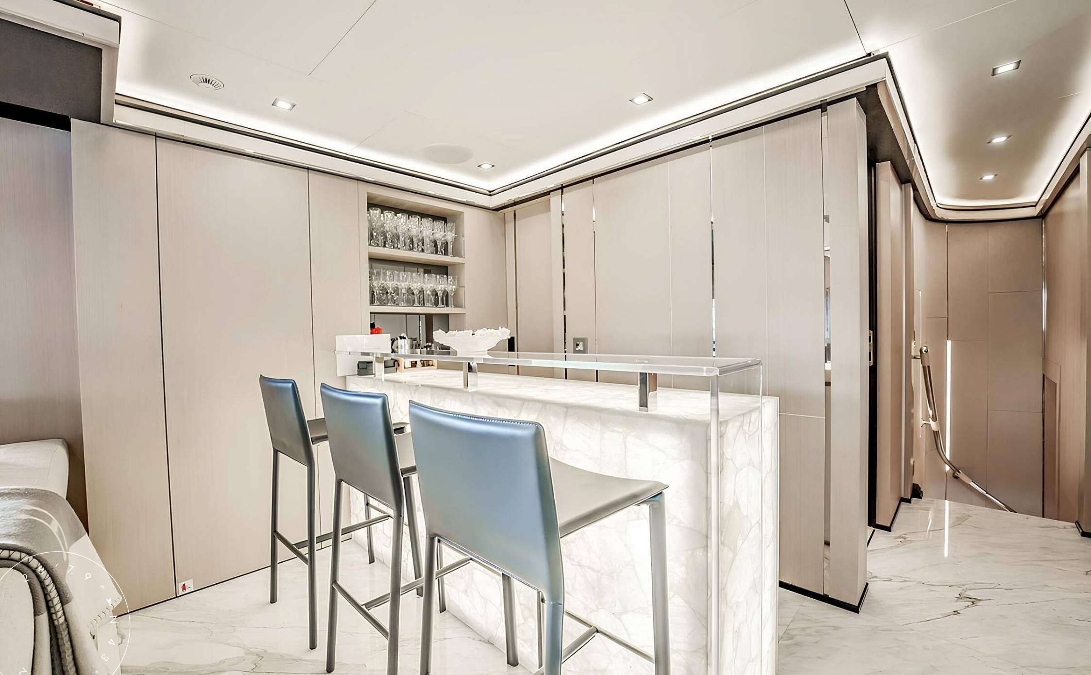
БАР В САЛОНЕ НА ВЕРХНЕЙ ПАЛУБЕ