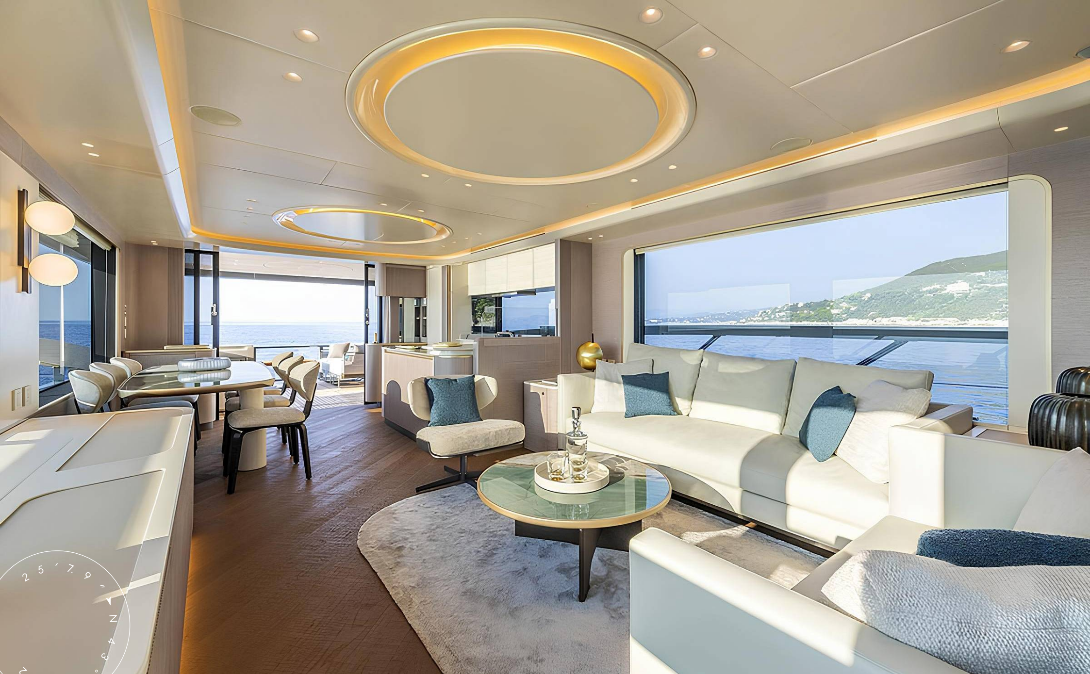
ЗОНА ОТДЫХА В ГЛАВНОМ САЛОНЕ