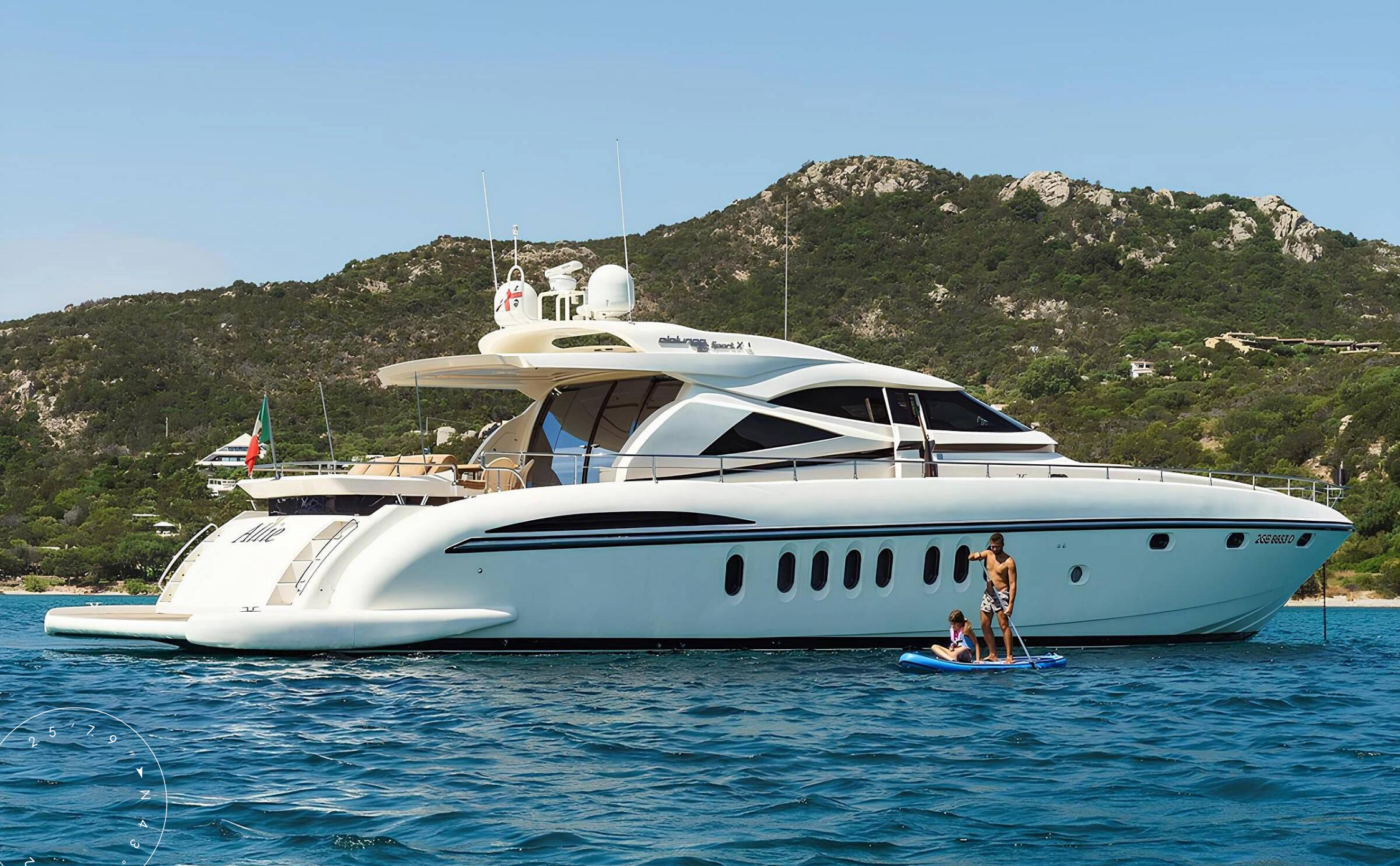
ЭКСТЕРЬЕР ALALUNGA 85X SPORT 2008 MY ALLIE