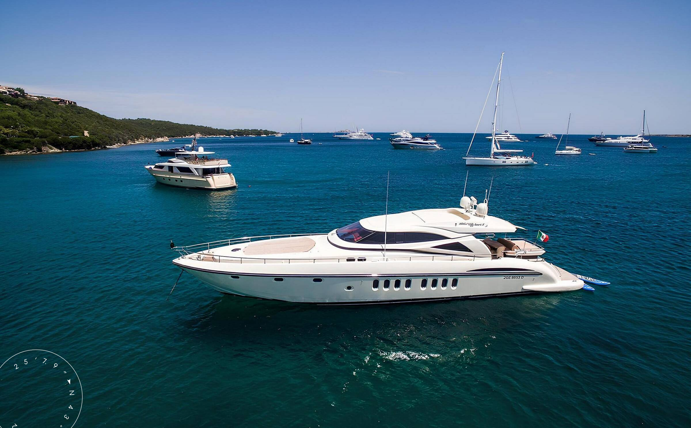
ЭКСТЕРЬЕР ALALUNGA 85X SPORT 2008 MY ALLIE