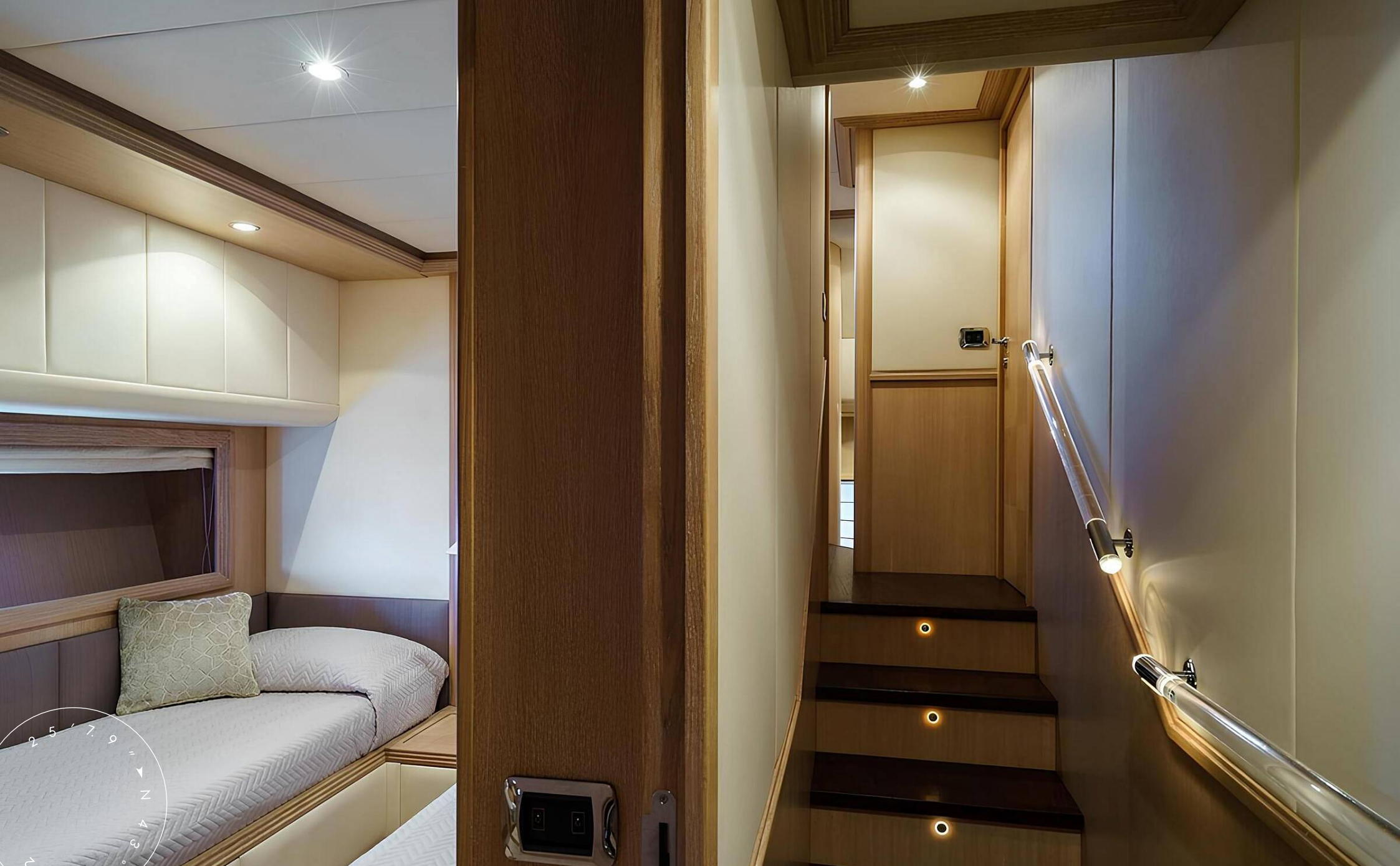
ЛЕСТНИЦА С ГЛАВНОЙ ПАЛУБЫ НА НИЖНЮЮ