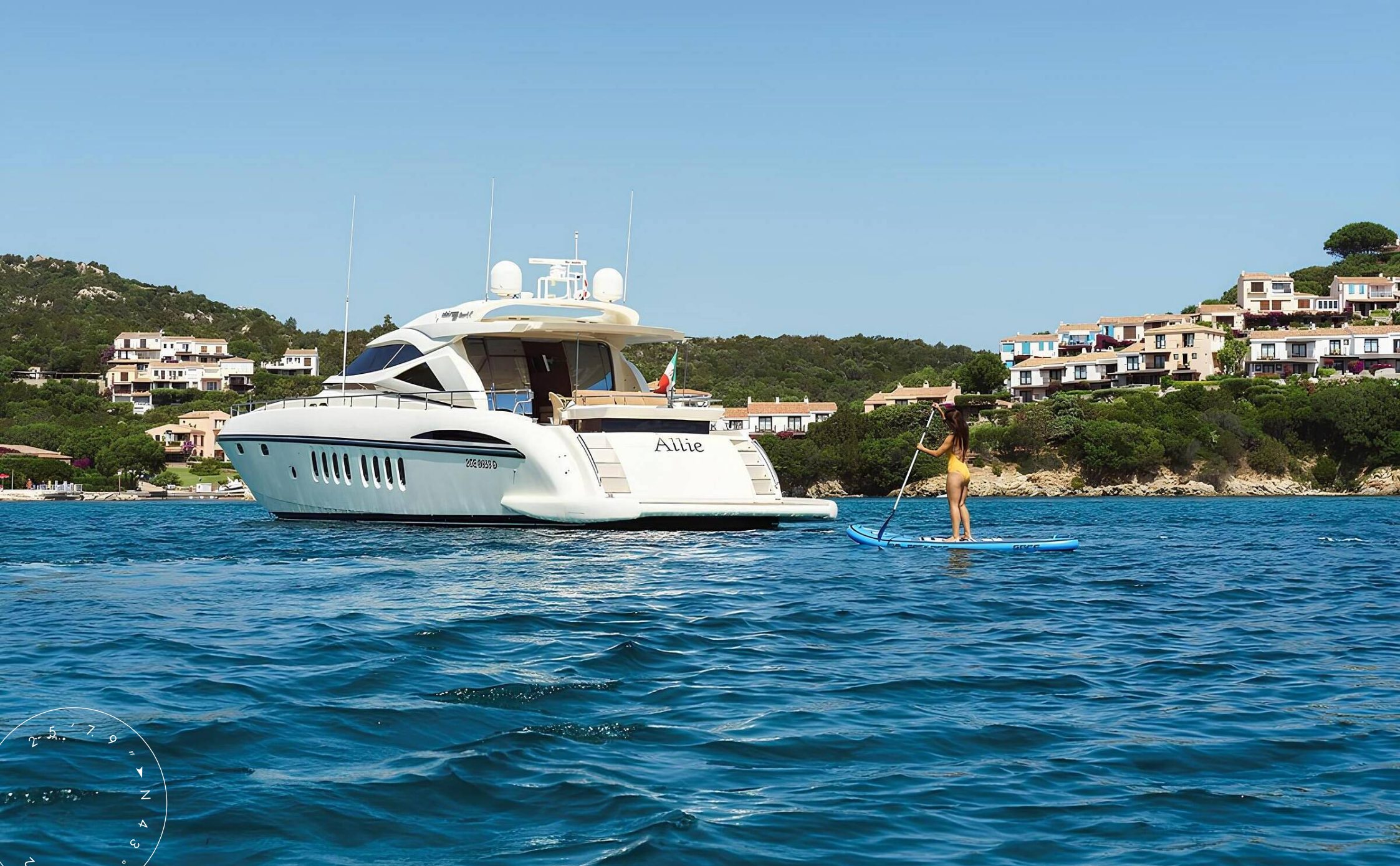
ЭКСТЕРЬЕР ALALUNGA 85X SPORT 2008 MY ALLIE