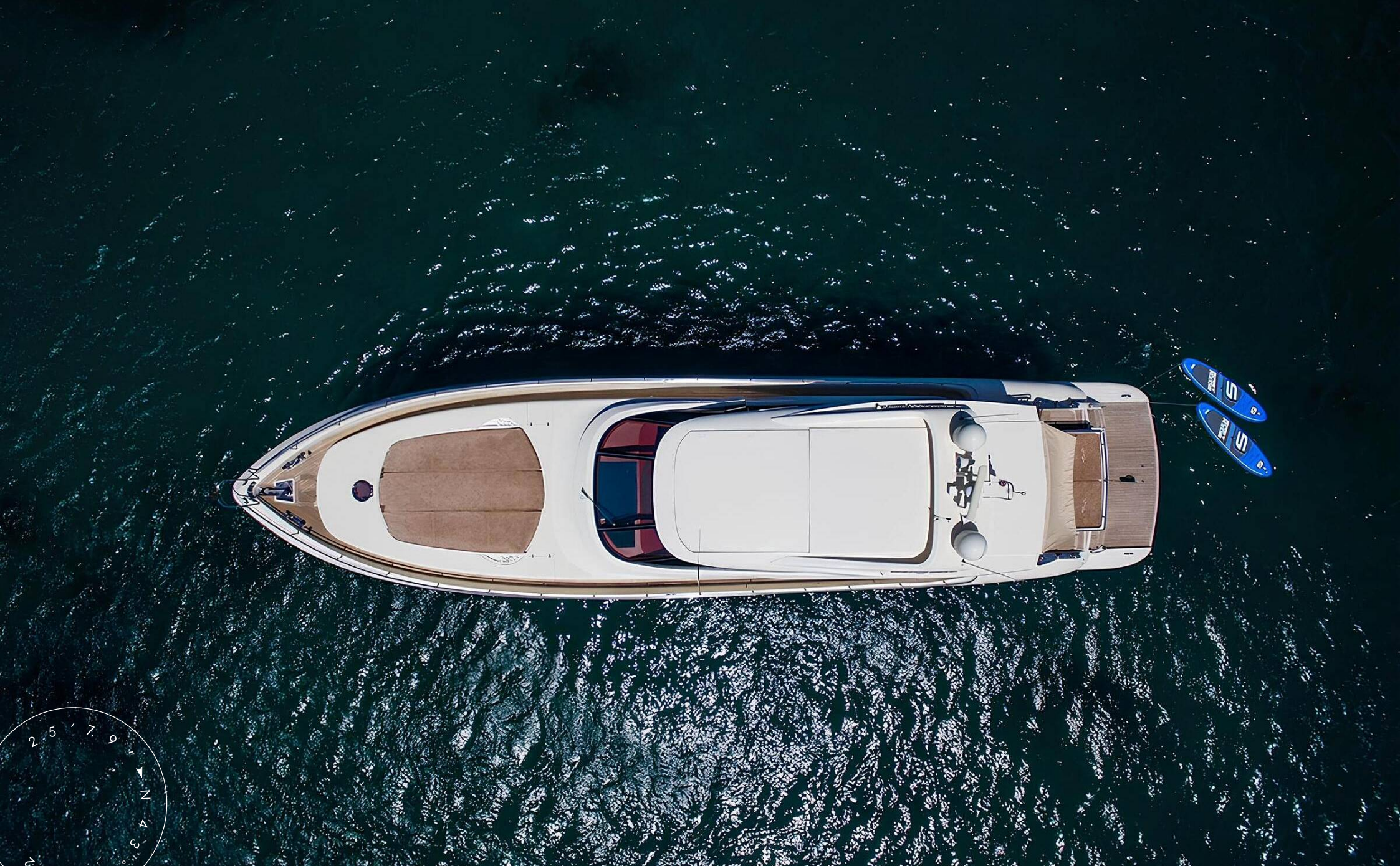
ЭКСТЕРЬЕР ALALUNGA 85X SPORT 2008 MY ALLIE