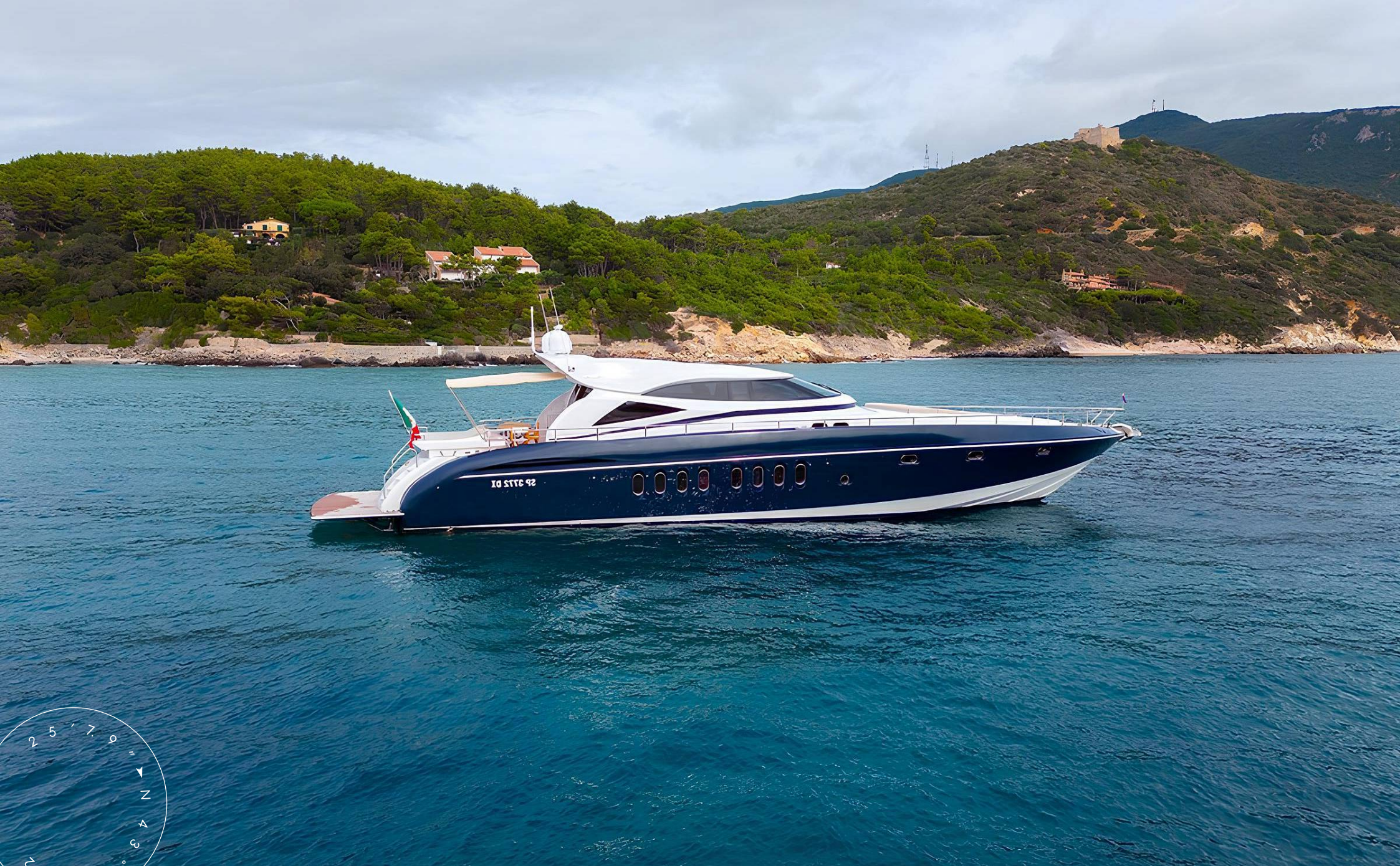
ЭКСТЕРЬЕР ALALUNGA 85X SPORT 2005 MY CINQUE LUNE