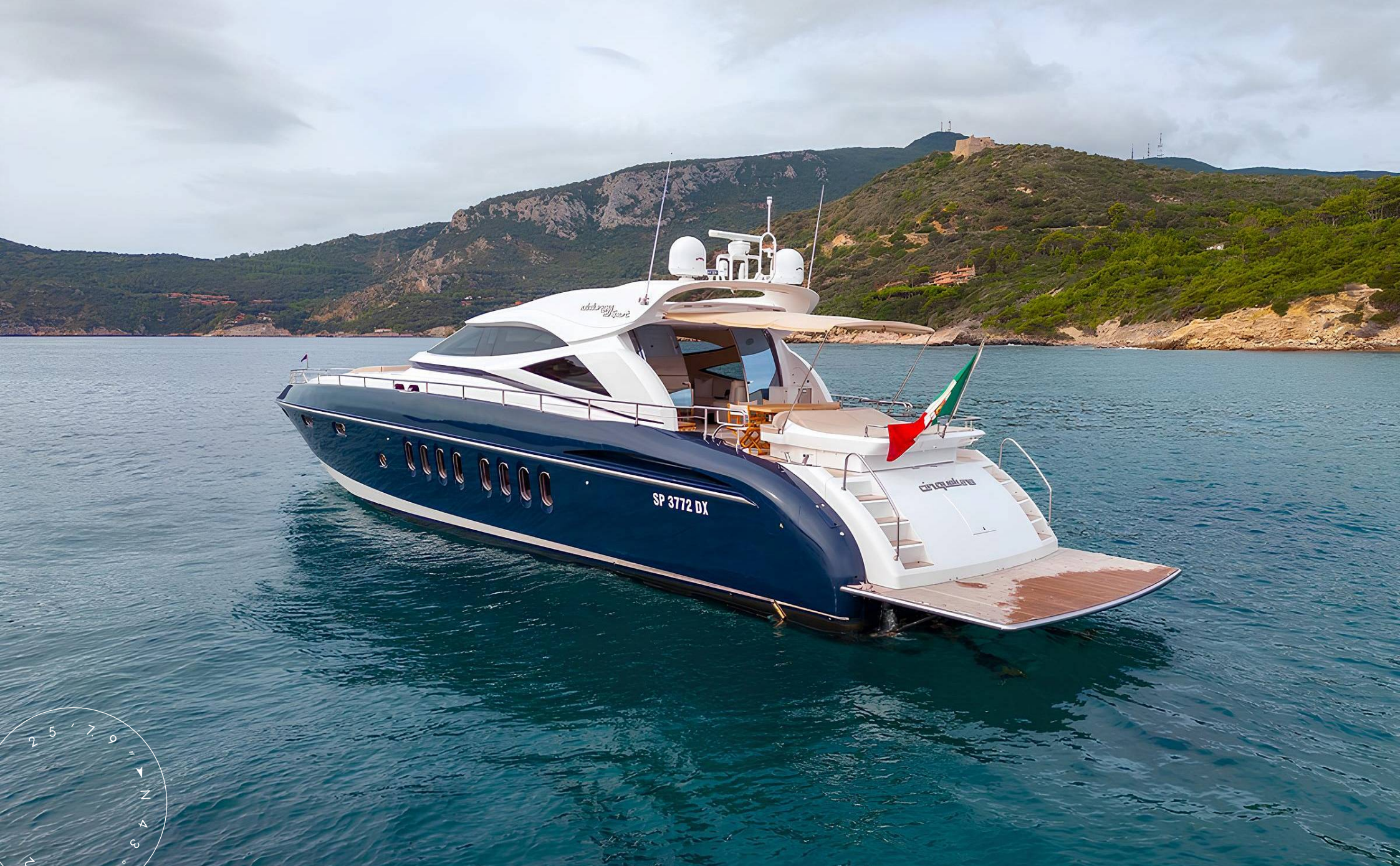
ЭКСТЕРЬЕР ALALUNGA 85X SPORT 2005 MY CINQUE LUNE