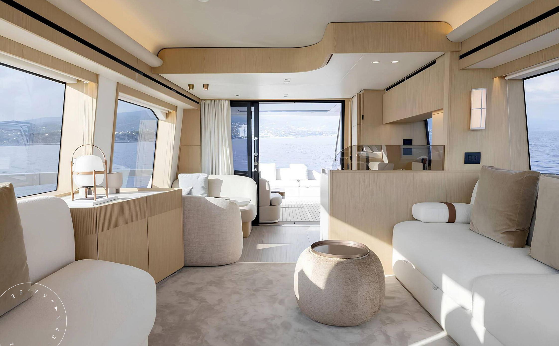
ЗОНА ОТДЫХА В ГЛАВНОМ САЛОНЕ