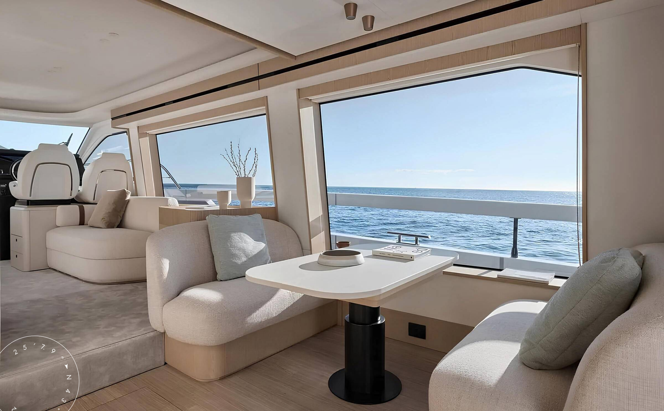
ОБЕДЕННАЯ ЗОНА В ГЛАВНОМ САЛОНЕ