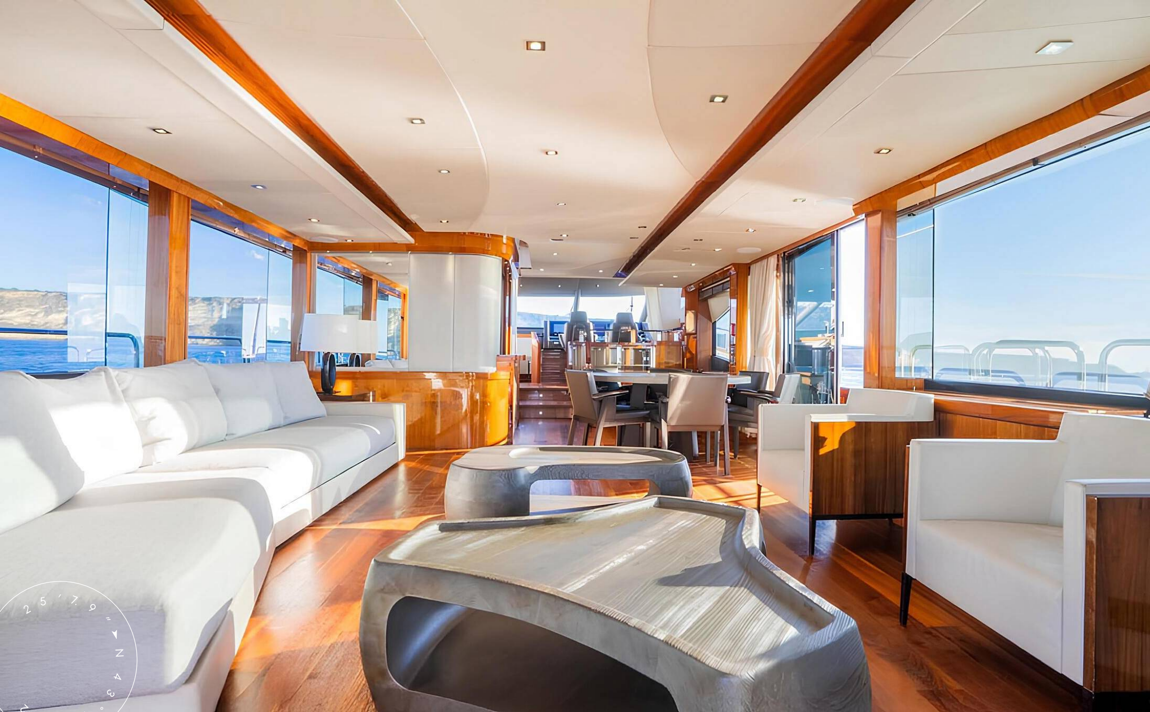
ЗОНА ОТДЫХА В ГЛАВНОМ САЛОНЕ