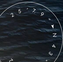
ЭКСТЕРЬЕР SUNSEEKER 28 METRE YACHT 2015 MY RIII