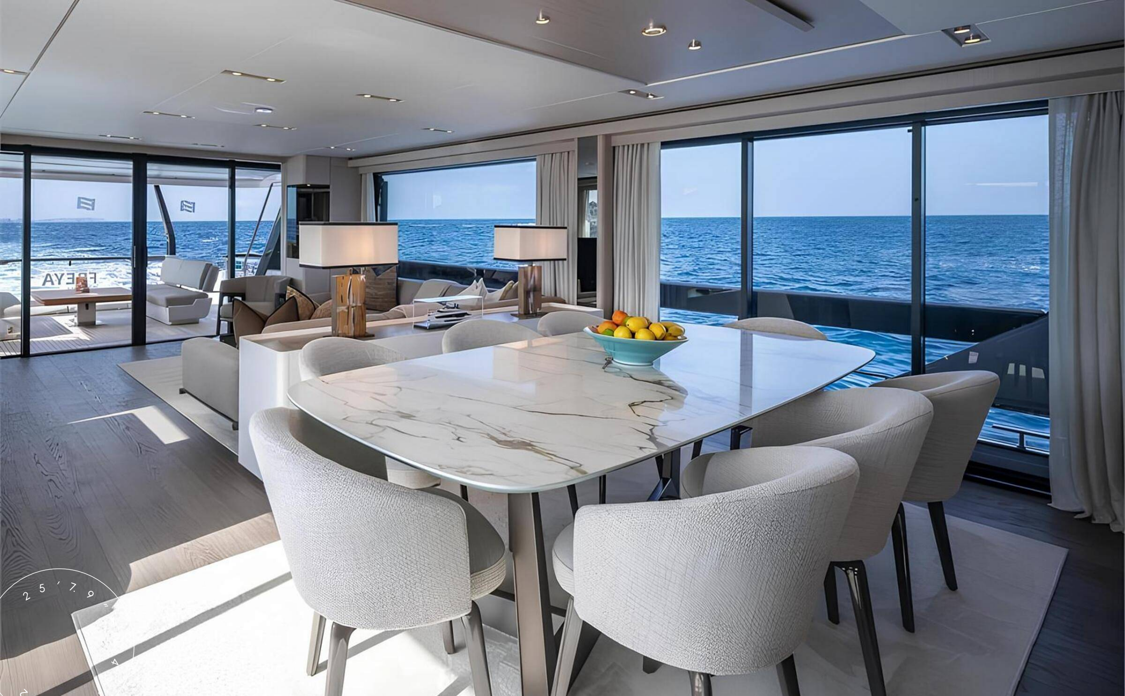
ОБЕДЕННАЯ ЗОНА В ГЛАВНОМ САЛОНЕ