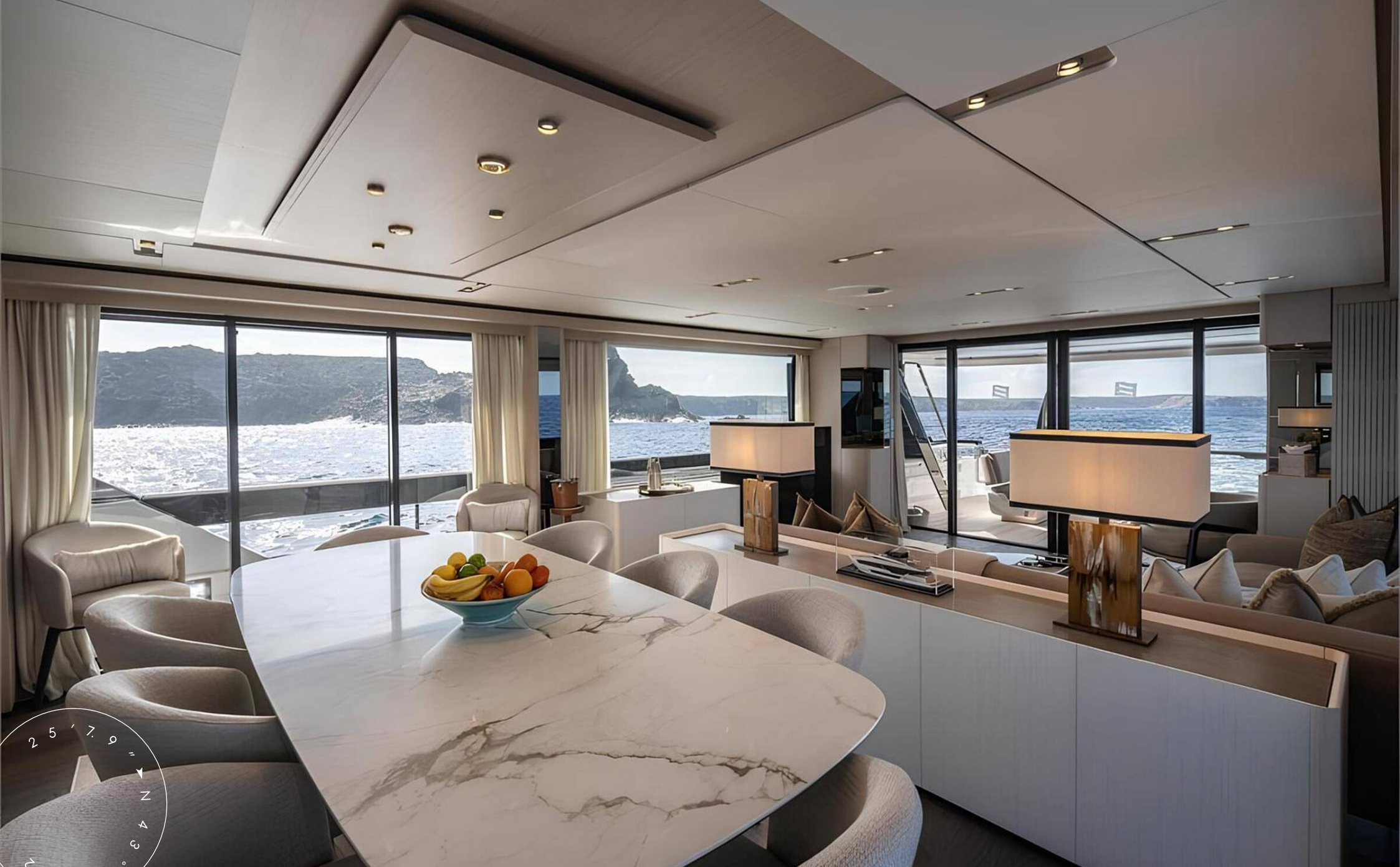
ОБЕДЕННАЯ ЗОНА В ГЛАВНОМ САЛОНЕ