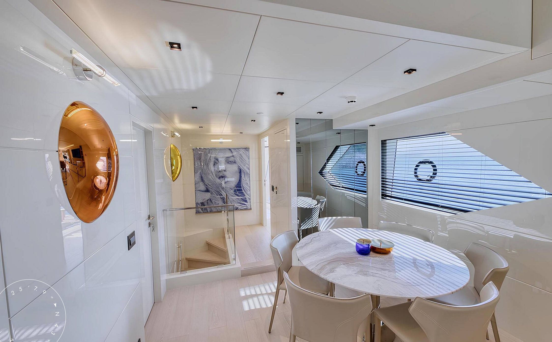
ОБЕДЕННАЯ ЗОНА В ГЛАВНОМ САЛОНЕ