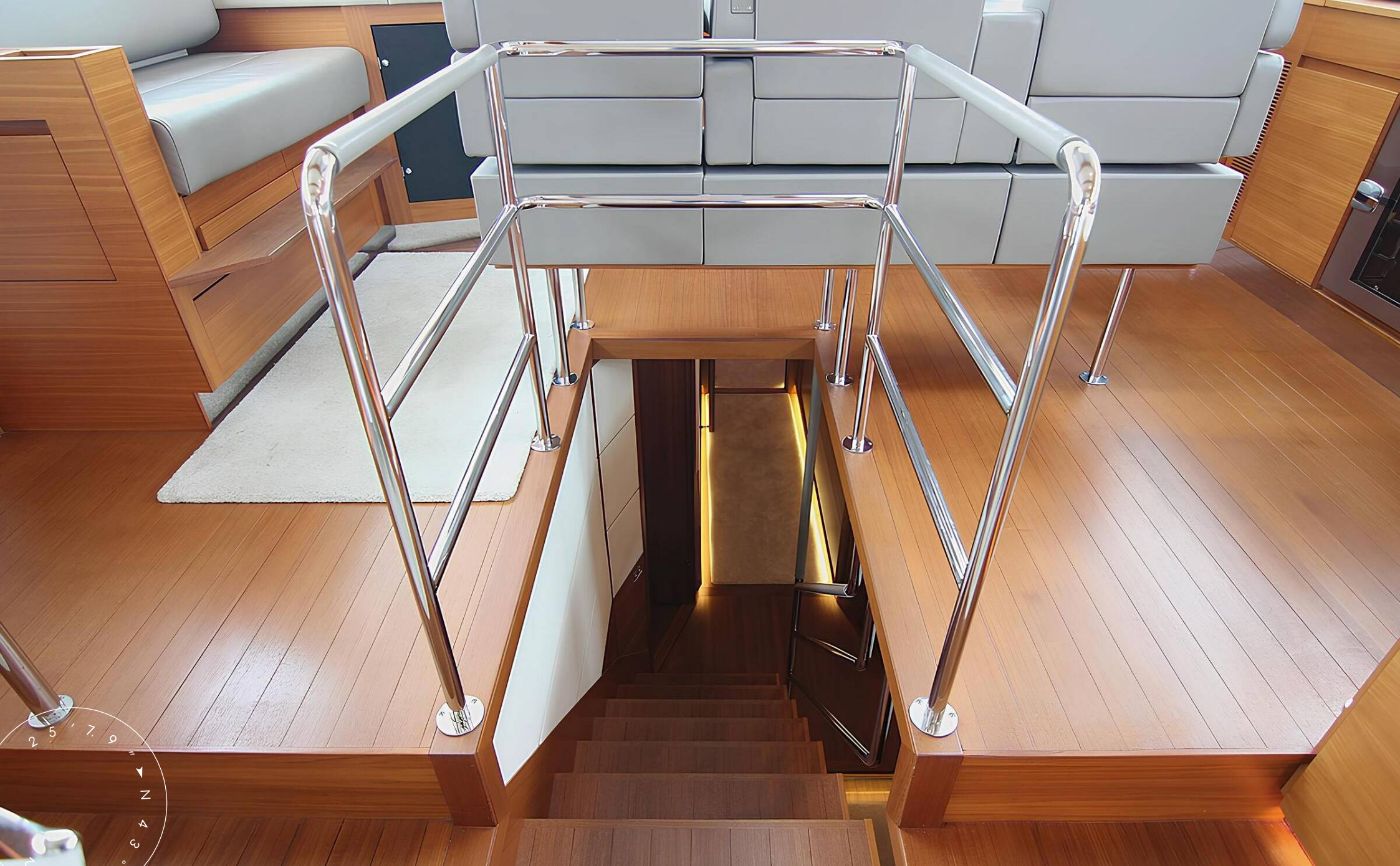
ЛЕСТНИЦА С ГЛАВНОЙ ПАЛУБЫ НА НИЖНЮЮ