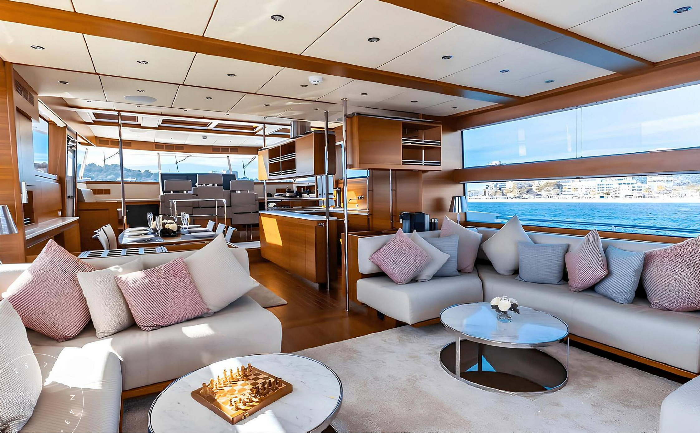
ЗОНА ОТДЫХА В ГЛАВНОМ САЛОНЕ