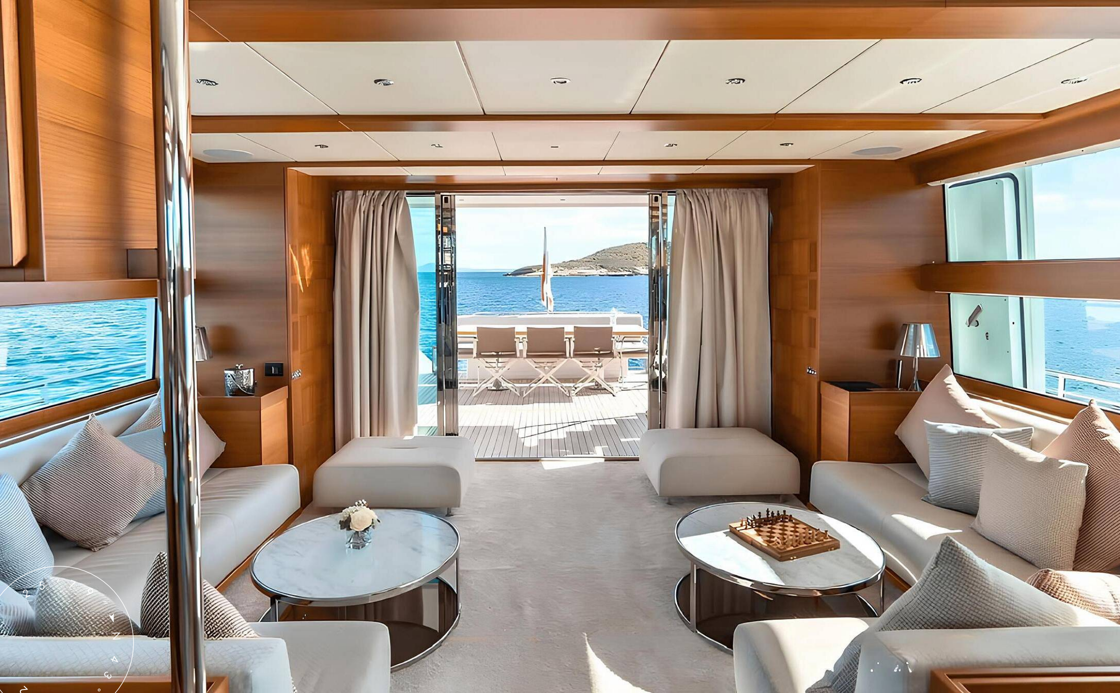
ЗОНА ОТДЫХА В ГЛАВНОМ САЛОНЕ