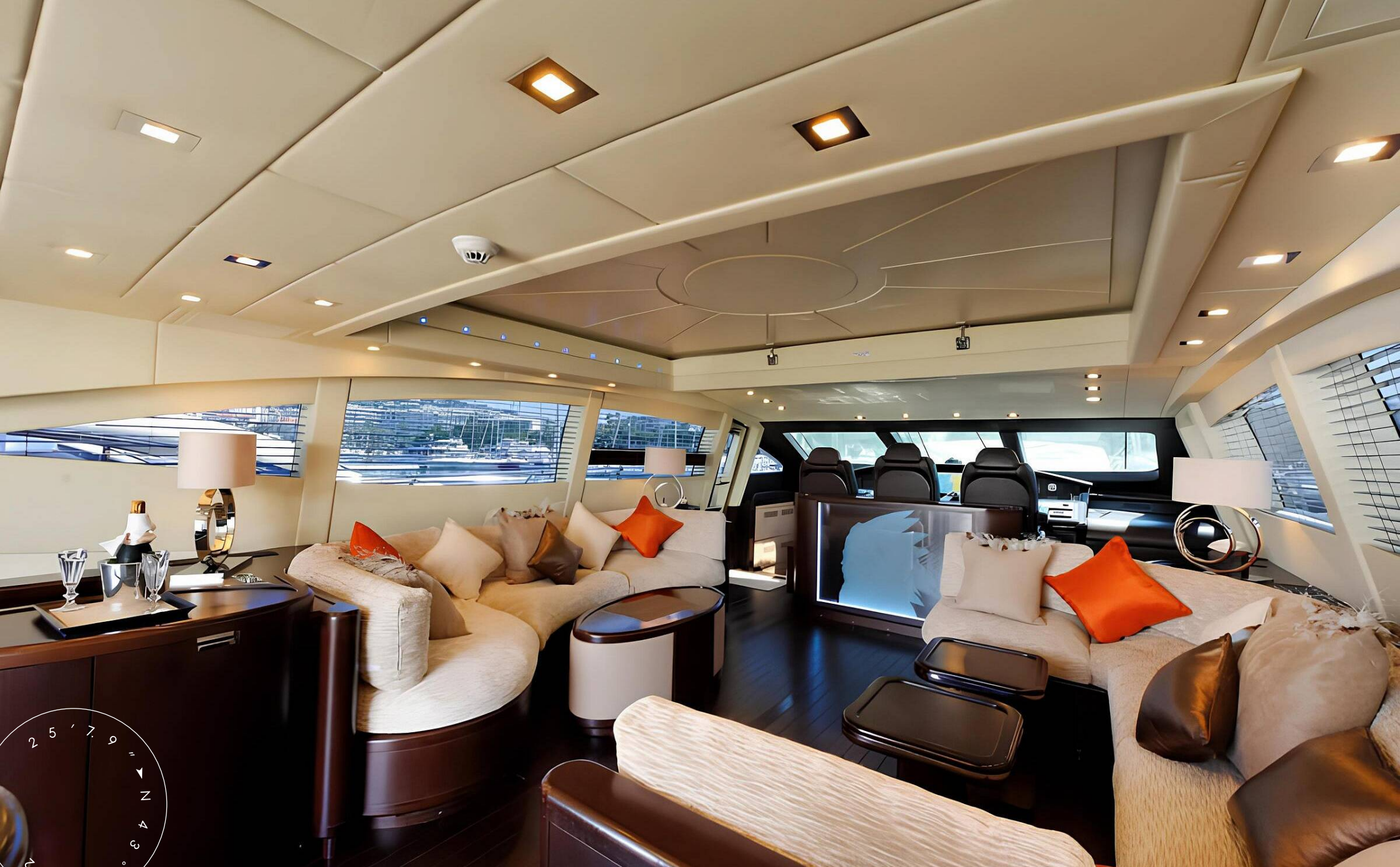
ЗОНА ОТДЫХА В ГЛАВНОМ САЛОНЕ