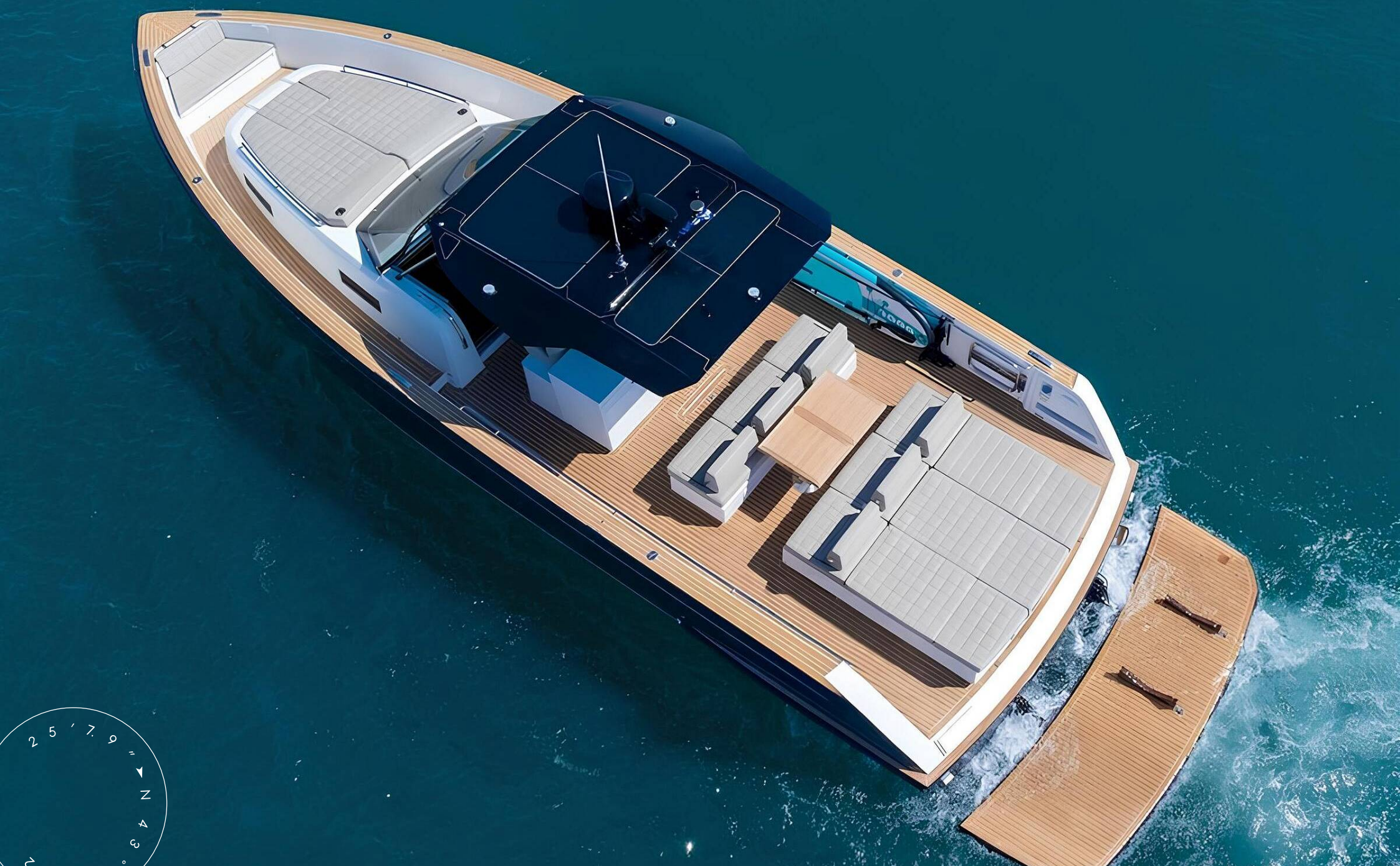
ЭКСТЕРЬЕР PARDО P43 2021 MY FIZZY