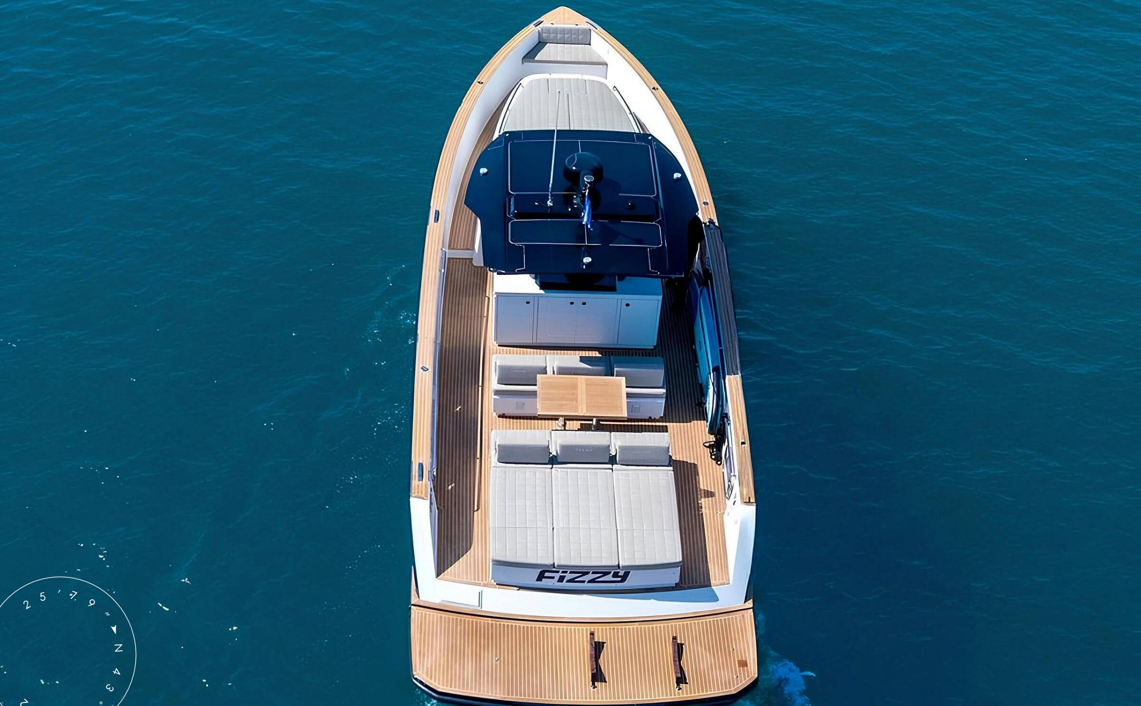
ЭКСТЕРЬЕР PARDO P43 2021 MY FIZZY