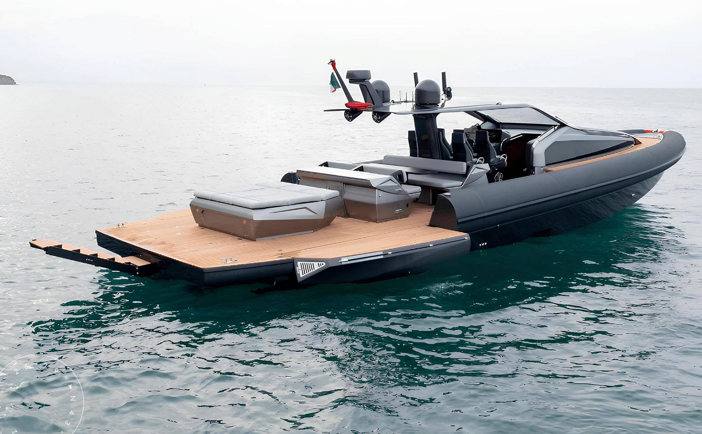
ЭКСТЕРЬЕР ANVERA 58 2025 MY DW