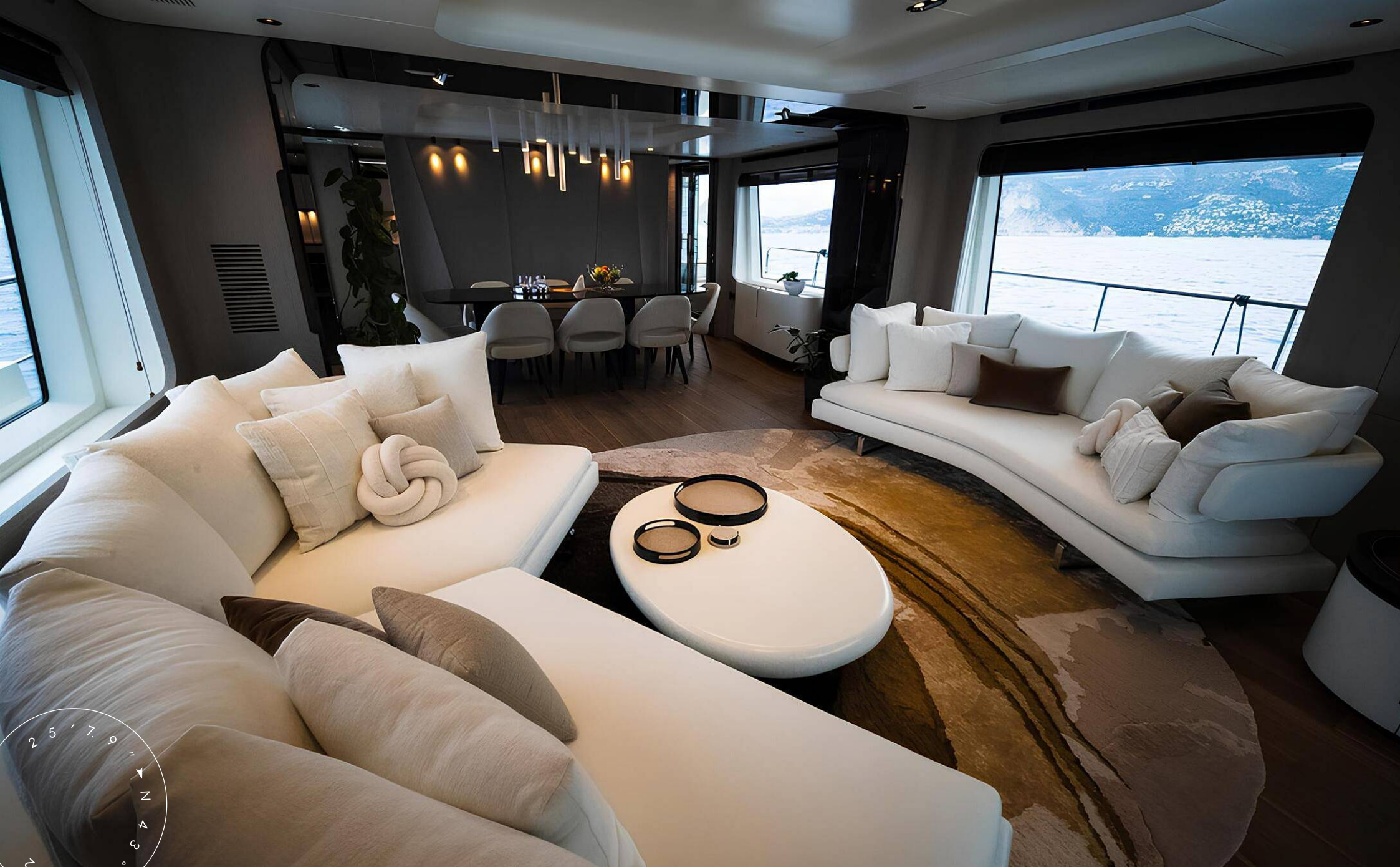
ЗОНА ОТДЫХА В ГЛАВНОМ САЛОНЕ