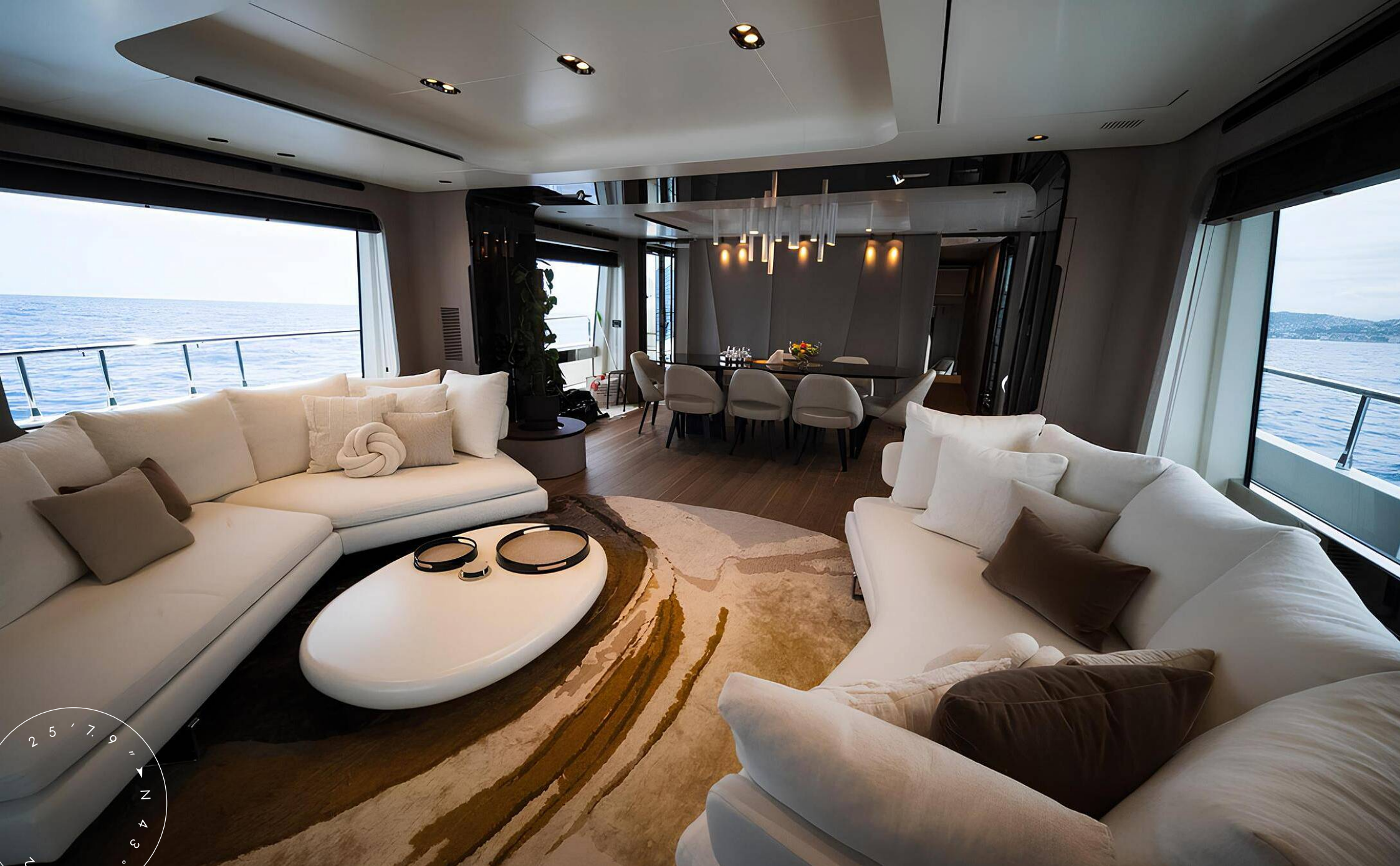
ЗОНА ОТДЫХА В ГЛАВНОМ САЛОНЕ