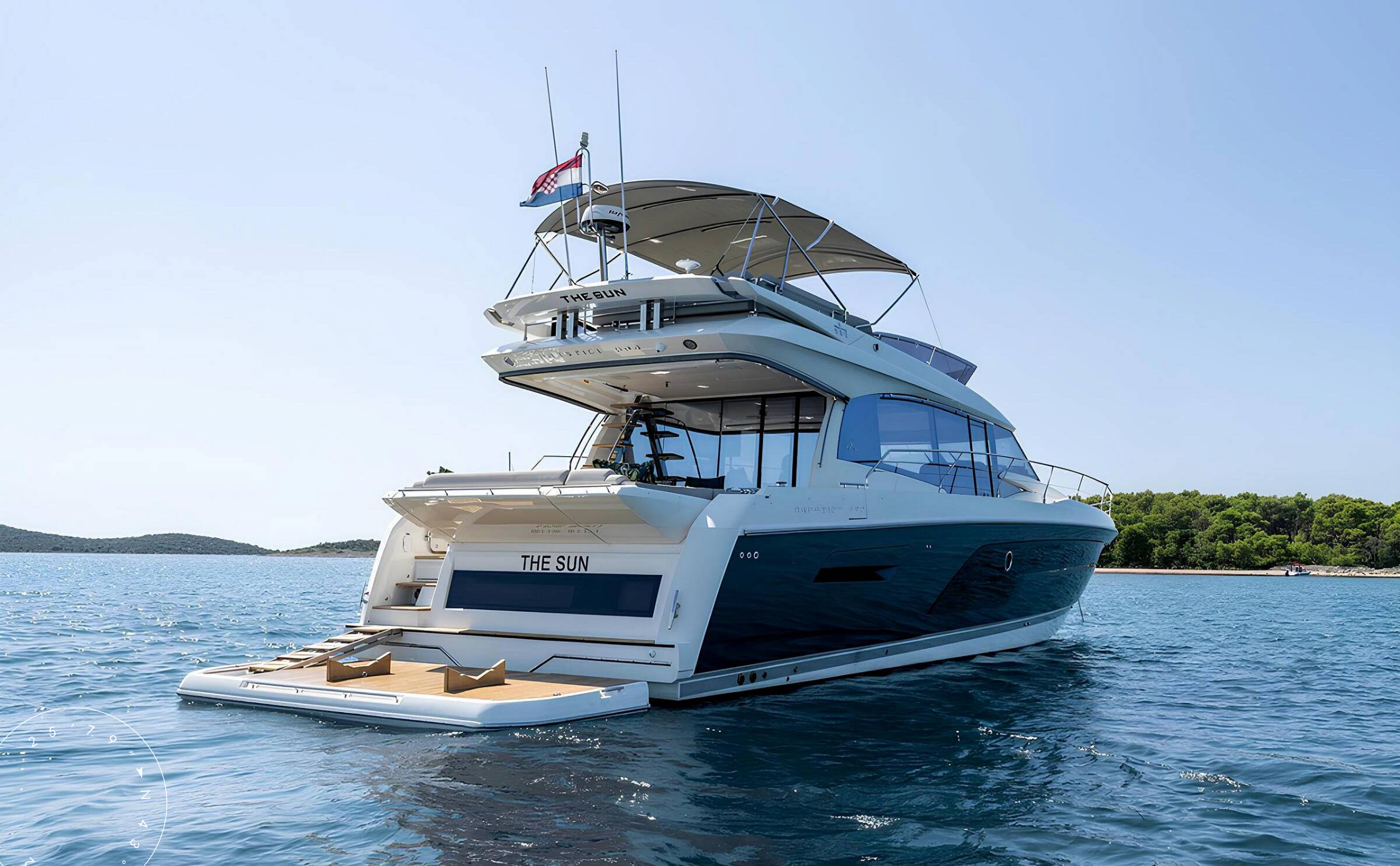
ЭКСТЕРЬЕР PRESTIGE 590 2020 MY THE SUN