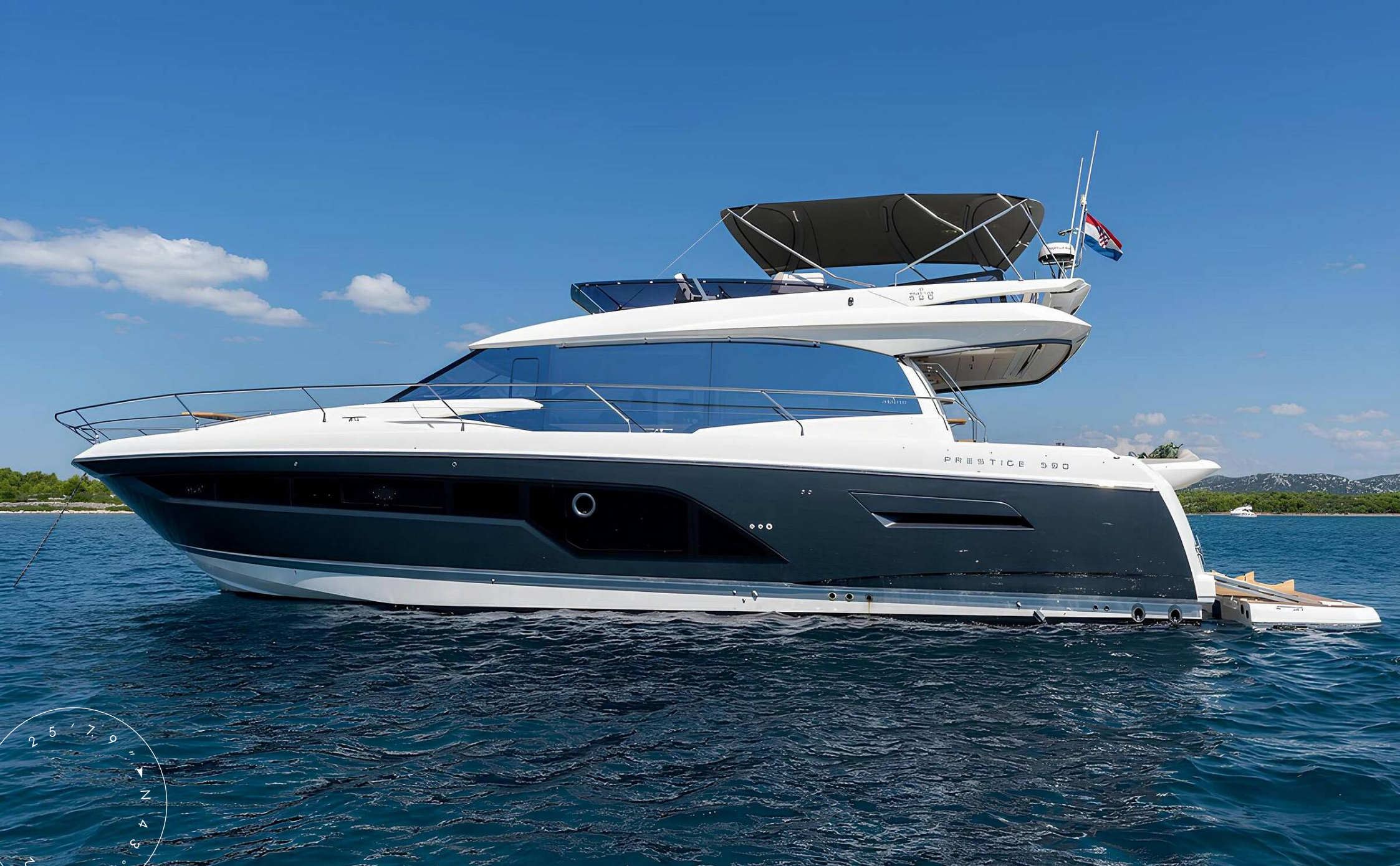
ЭКСТЕРЬЕР PRESTIGE 590 2020 MY THE SUN