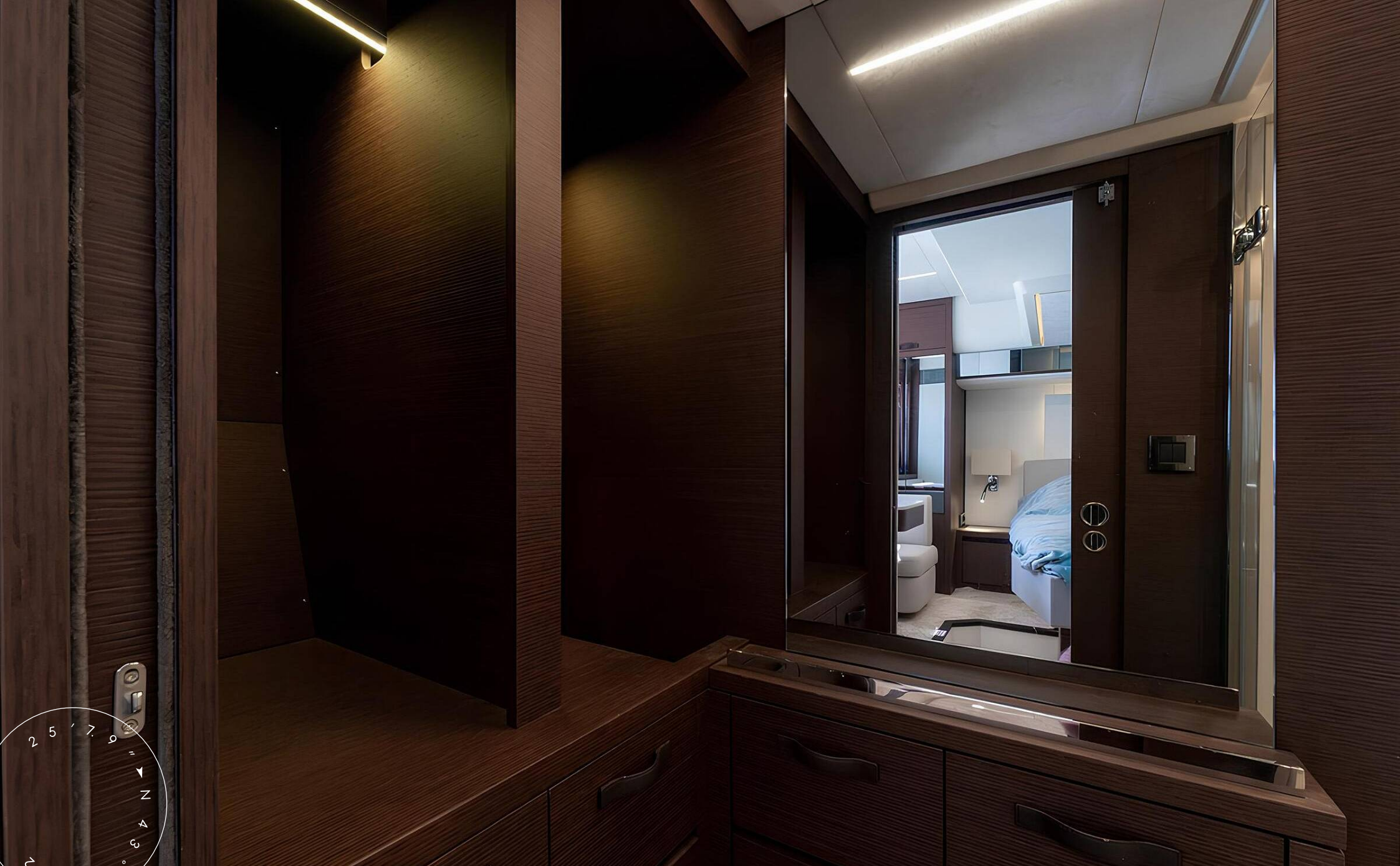
ГАРДЕРОБНАЯ В КАЮТЕ ВЛАДЕЛЬЦА