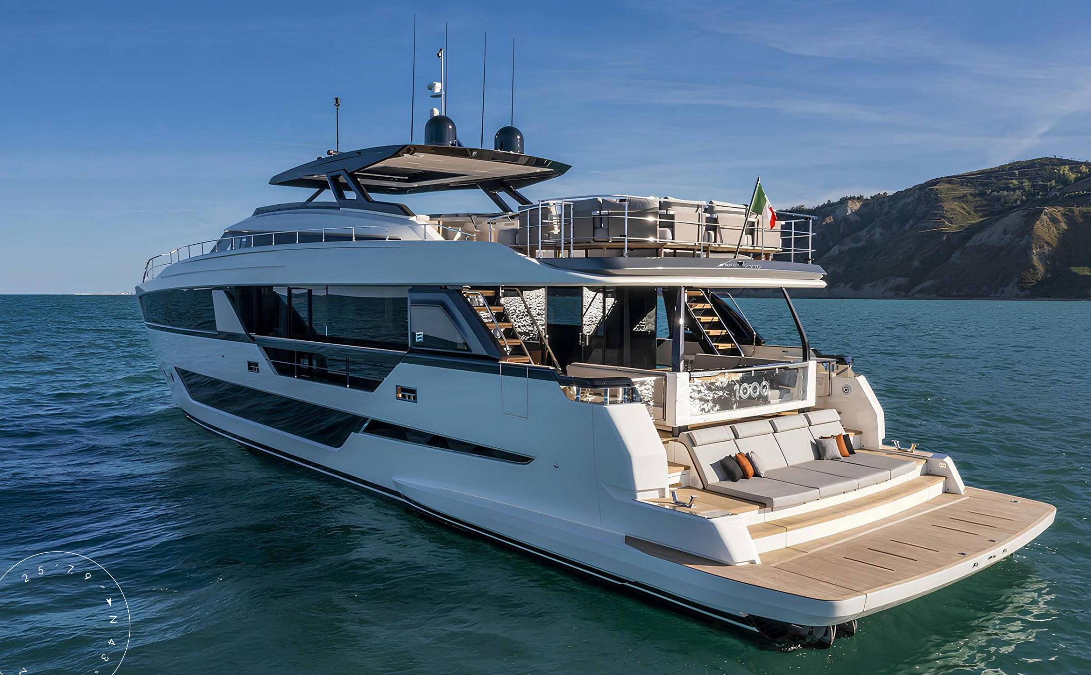
ЭКСТЕРЬЕР FERRETTI 1000 2023 MY DANIMA