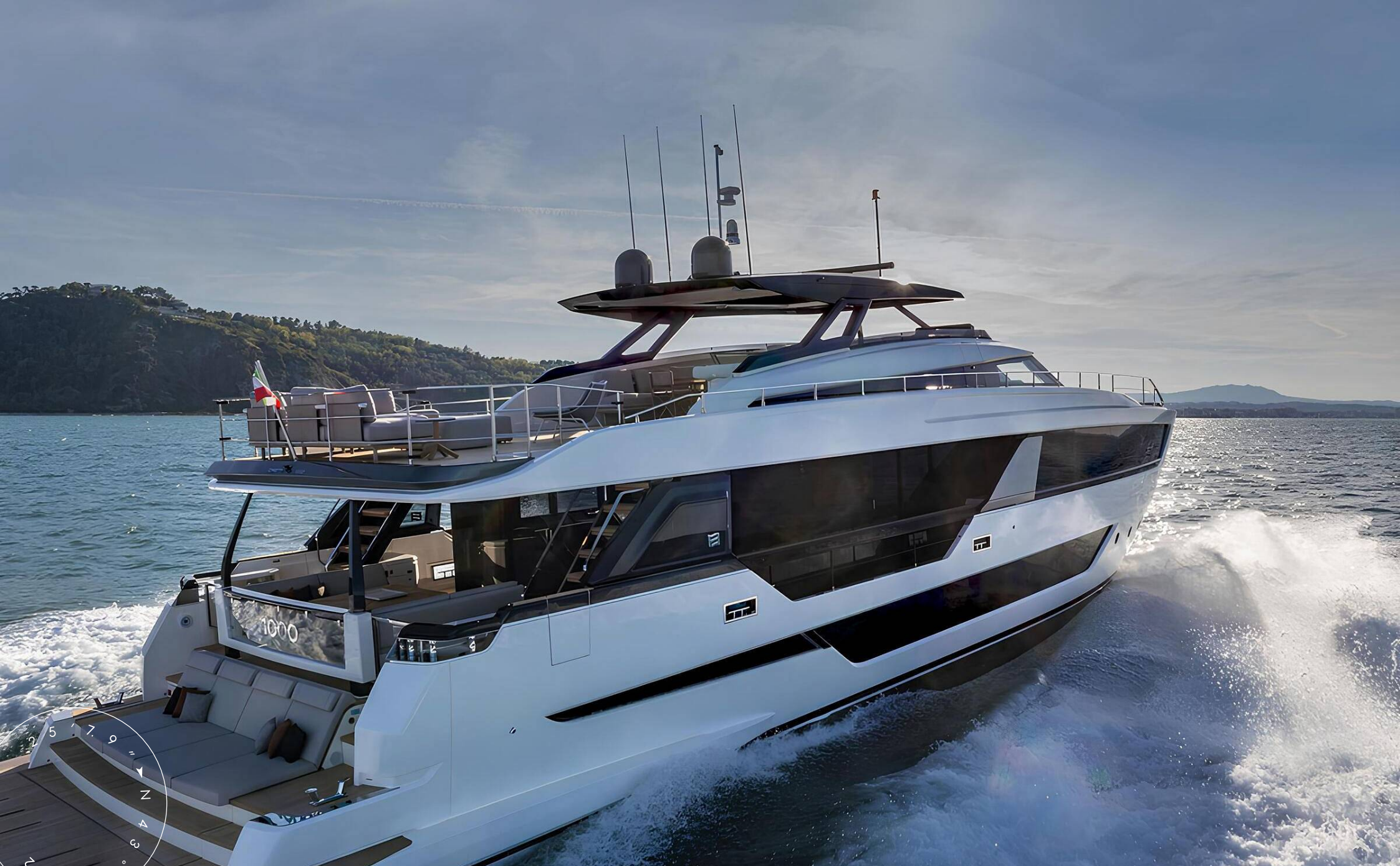
ЭКСТЕРЬЕР FERRETTI 1000 2023 MY DANIMA