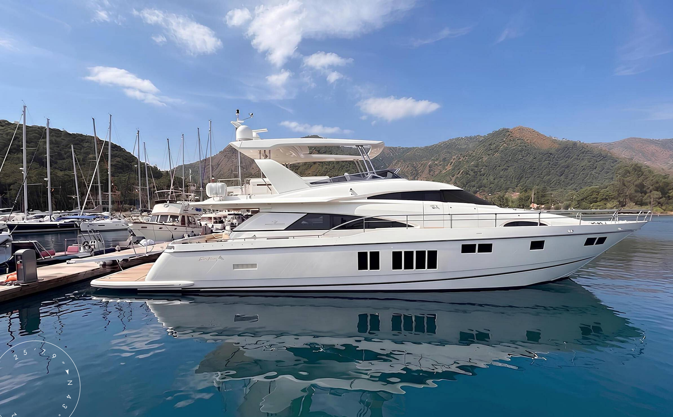
ЭКСТЕРЬЕР FAIRLINE SQUADRON 78 2014 MY SED