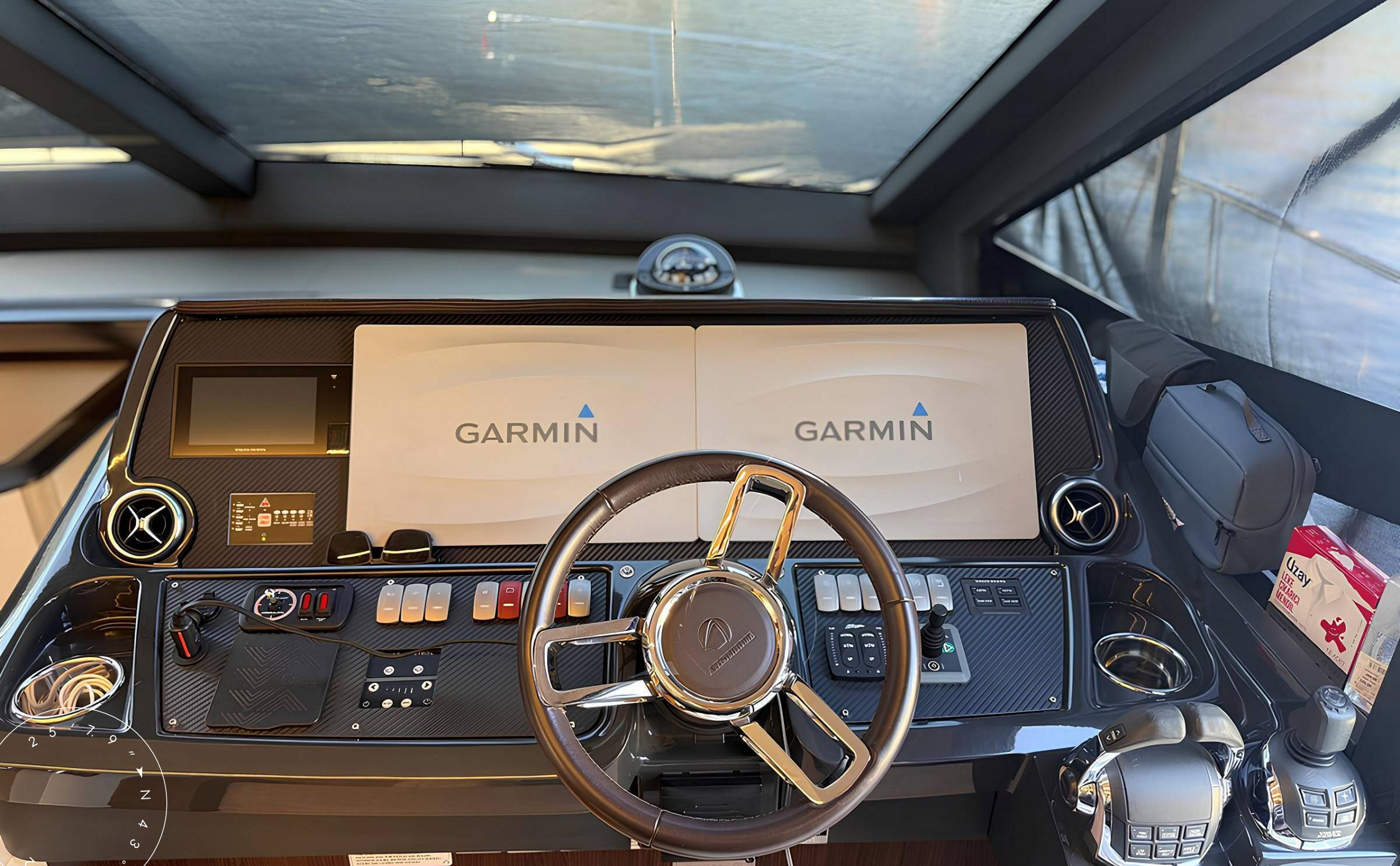
ГЛАВНЫЙ ПОСТ УПРАВЛЕНИЯ