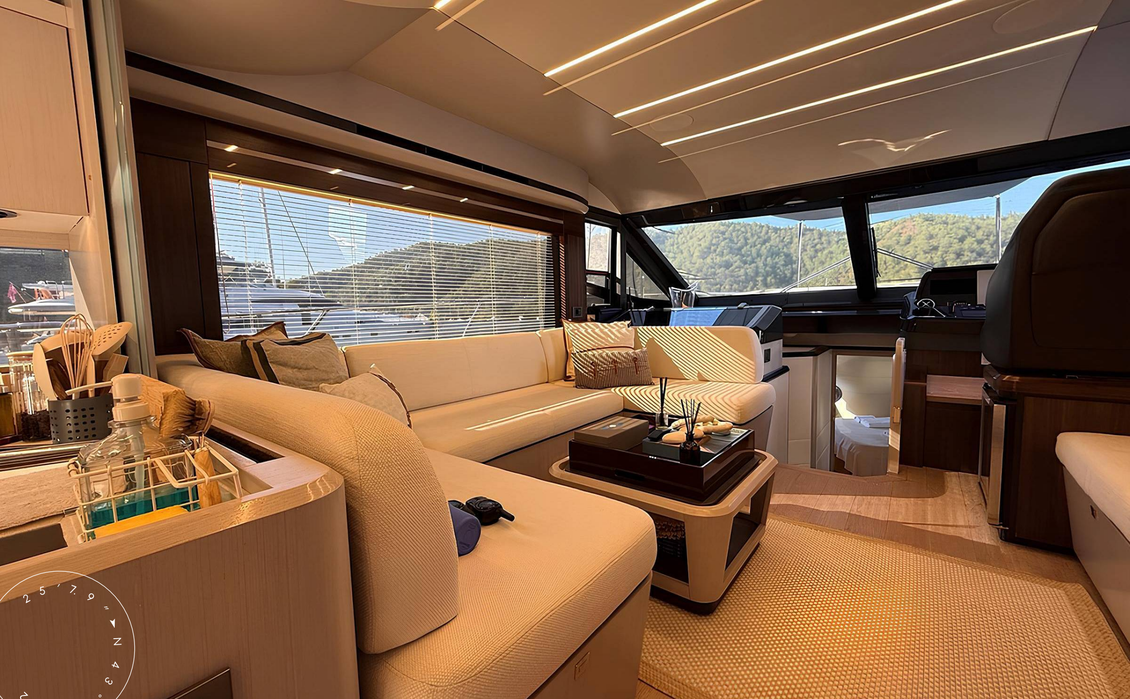
ЗОНА ОТДЫХА В ГЛАВНОМ САЛОНЕ